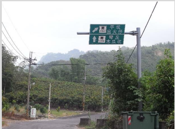
179 線道與 179-1 線道交界處