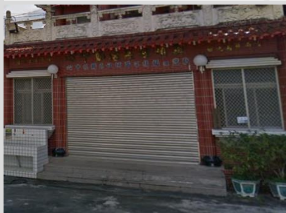
西埔社區活動中心