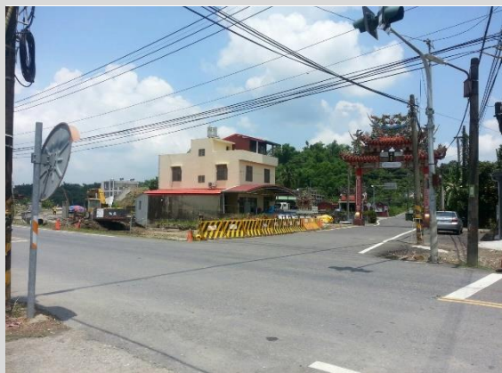
台 20 乙及 174-2 交界