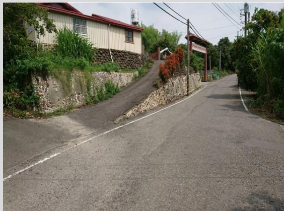
區道南 174-2 街道