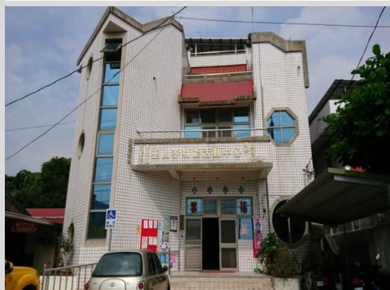
玉山里活動中心及辦公處