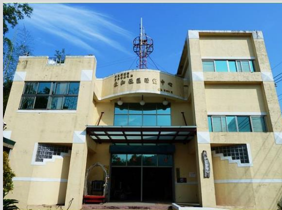
東和社區活動中心