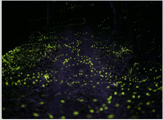
關山里境內螢火蟲