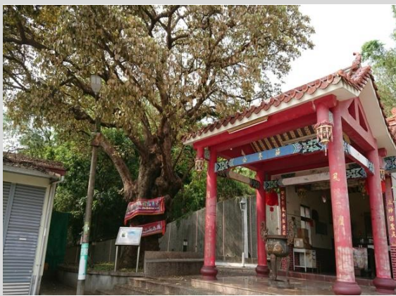
頭份茄苳公百年老樹