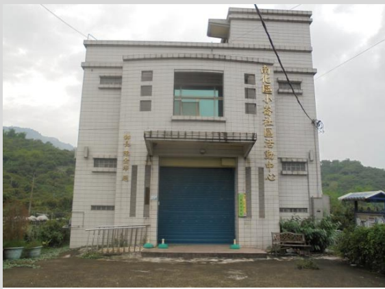
小崙社區活動中心