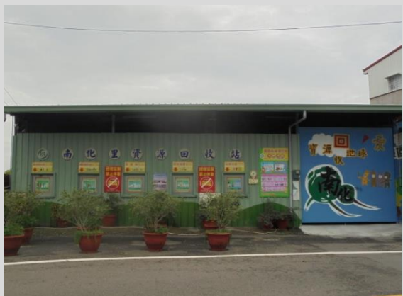
南化里資源回收站