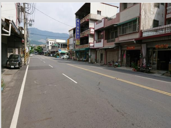
台 20 線北寮街道