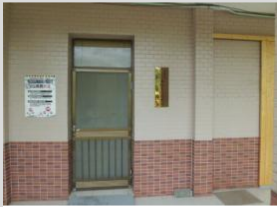
岡林里活動中心及辦公處