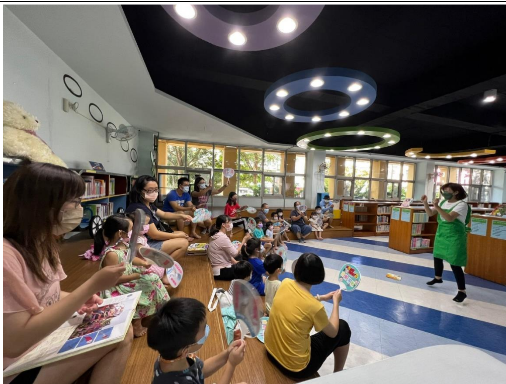
家長與小孩聚精會神聽著故事