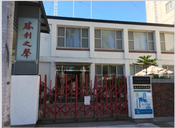
勝利之聲廣播公司