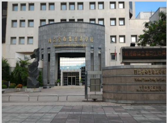
國立臺南生活美學館