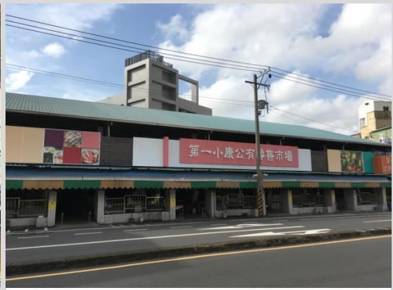
第一小康公有零售市場