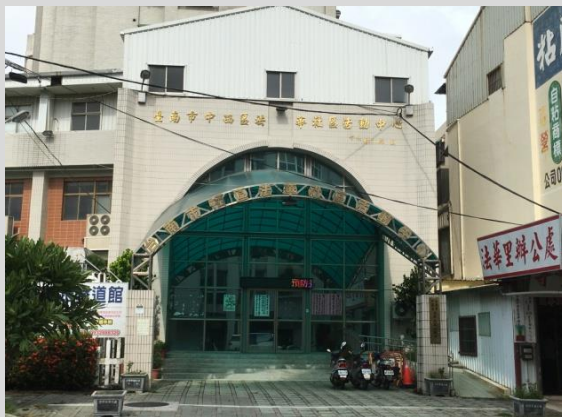
法華社區活動中心