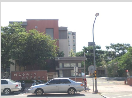
臺南大學附屬啟聰學校