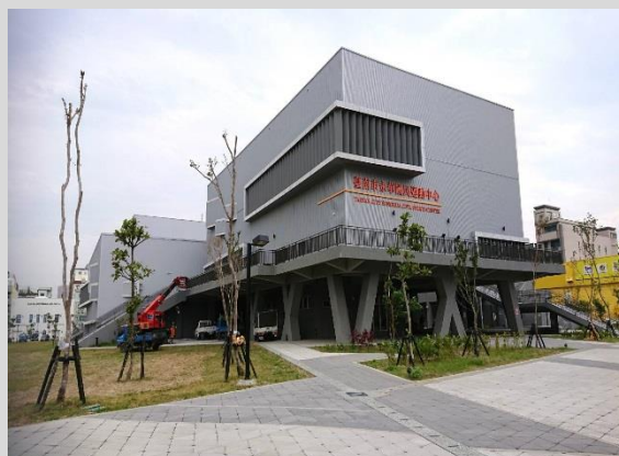
臺南市永華國民運動中心