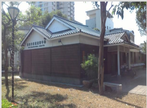
臺南市家庭教育中心