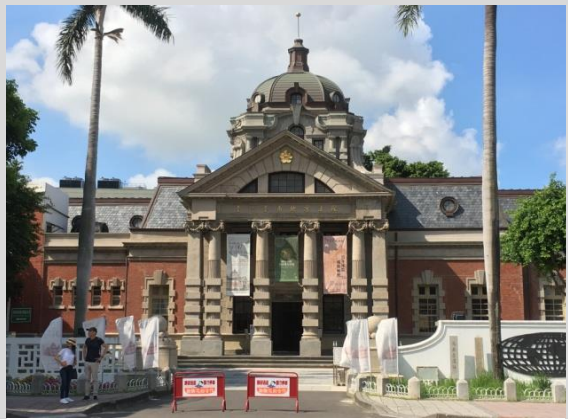
臺南地方法院舊址