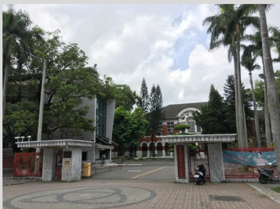
臺南女子高級中學