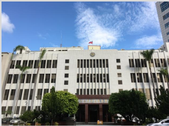
臺灣高等法院臺南分院