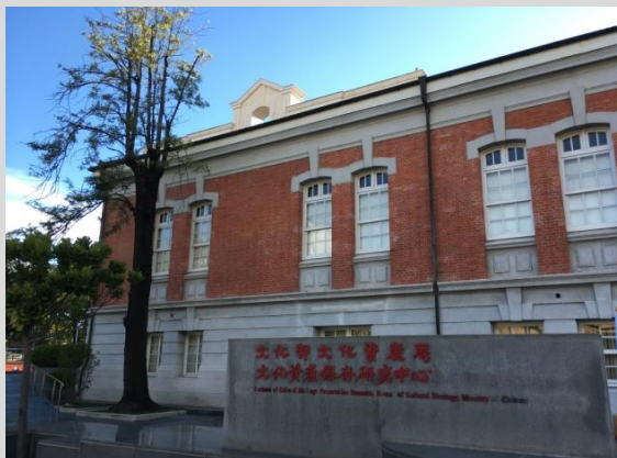
文化資產保存中心