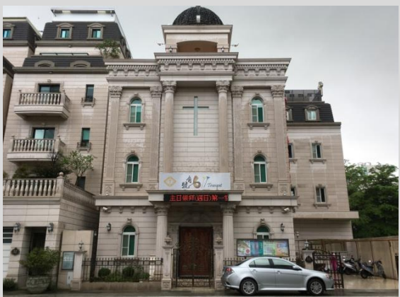
號角 611 靈糧堂