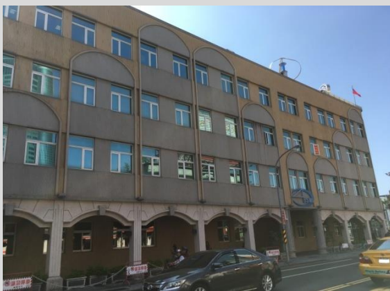
經濟部標準檢驗局臺南分局