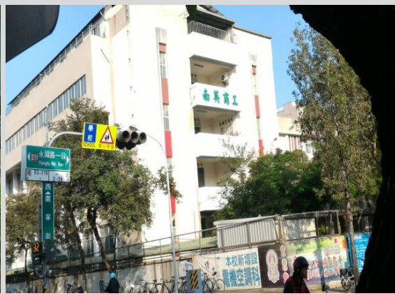
南英高級商工職業學校