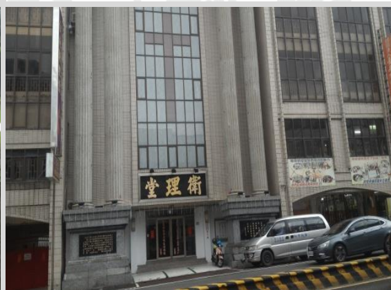
基督教衛理堂教會