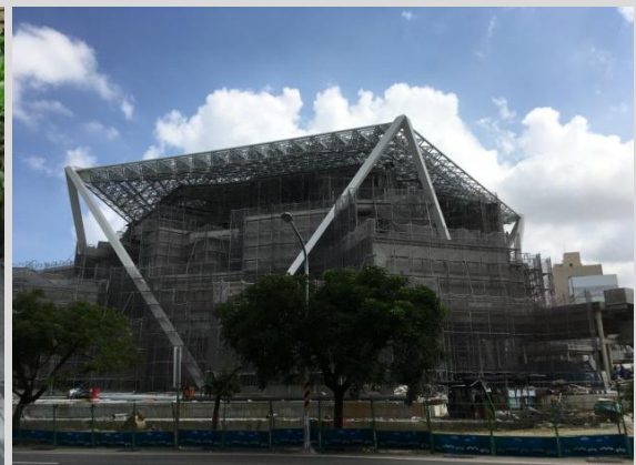
臺南市美術館二館