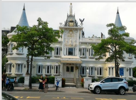
內政部移民署臺南服務站