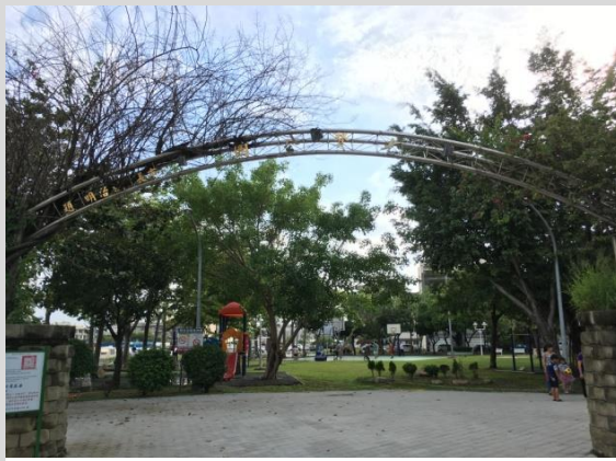
公兒 12 號社區公園