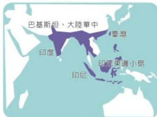
■ 臺灣夜鷹分布範圍

臺灣夜鷹的地理分布相當廣，臺灣地區為特有亞種— Caprimulgus affinis stictomus