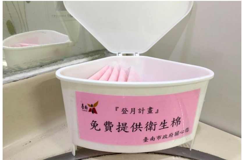
照片說明：透過登月計畫推動，免費提供衛生棉。