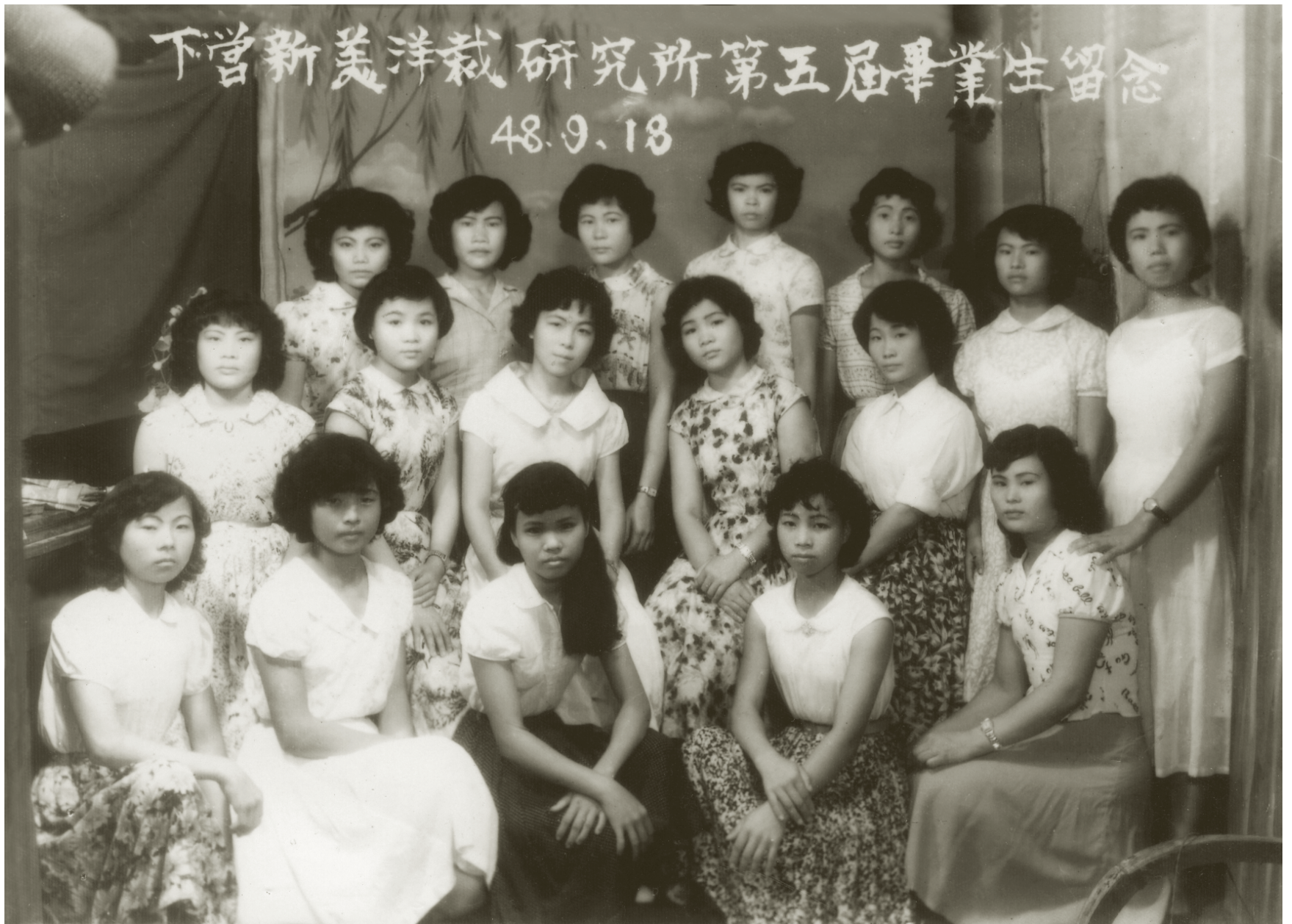
洋裁畢業照 民國48年(1959)