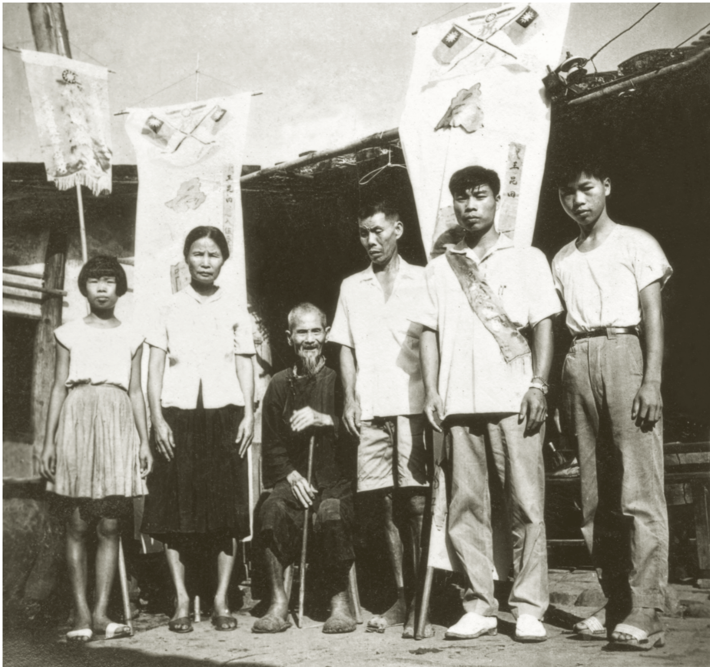
當兵為國增光 民國49年(1960)