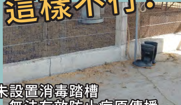
未設置消毒踏槽 無法有效防止病原傳播