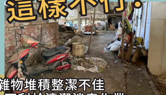
雜物堆積整潔不佳 不利於清潔消毒作業