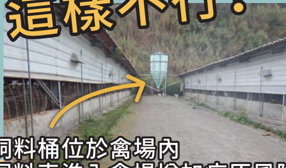
飼料桶位於禽場內 飼料車進入禽場增加病原風險