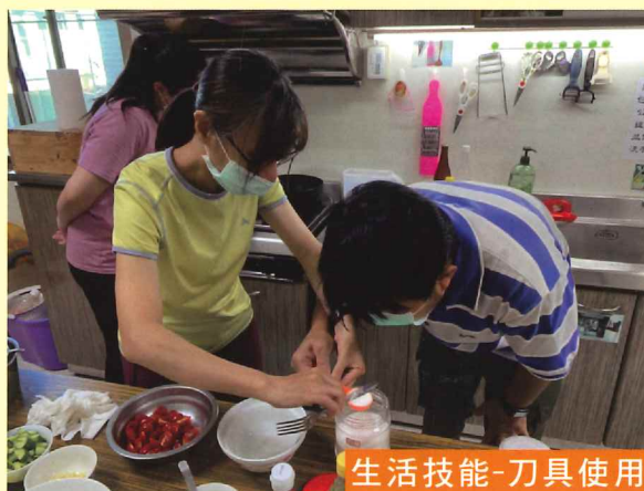
生活技能-刀具使用

食材選購、簡易食物烹調、衣物及環境整理、個人護理及衛生訓練、一般家電用品或 3C 電子用品操作等生活技能訓練。