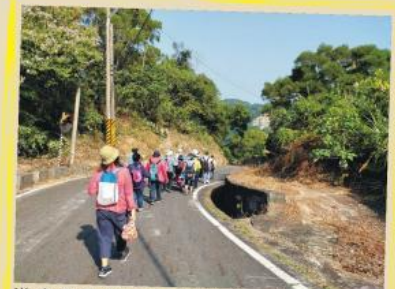
遊客變身為12歲的小學生，整隊後跟著路隊長走路上學去