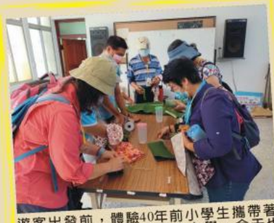
遊客出發前，體驗40年前小學生攜帶著媽媽用布巾包妥的便當去上學，今天也要自己帶著便當