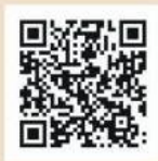
2022東山 咖啡莊園交流賽 烘焙日紀錄影片

經過現場遊客試飲投票，2022東山咖啡莊園交流賽冠軍得主為瑞亦思咖啡，其日曬淺焙的鐵比卡咖啡風味令現場遊客為之驚豔，冠軍實至名歸。亞軍及季軍分別為崁頭山咖啡館及金讚咖啡園，均獲得極高的評價。經由本次交流賽，東山咖啡莊園主互相切磋交流技術，並了解市場喜好，一舉數得。