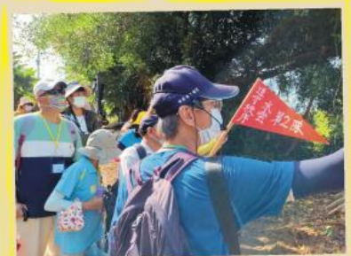
解說員帶領遊客在尪仔上天最佳鳥瞰點，欣賞龜重溪及遠方南溪里的風景，最遠還可看到柳營