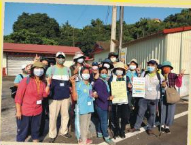
遊客一同於牛肉崎搭乘黃7公車到尪仔上天展開遊程