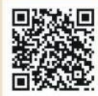
悠活臺南第34期 台南精品咖啡評鑑冠軍

感謝行政院農委會農糧署、臺南市政府、東山區公所、觀光局、農業局、東山農會不遺餘力地幫助咖啡農從種植、烘豆、沖煮行銷推廣產地認證，給了大力的幫助，希望東山咖啡能更上一層樓。