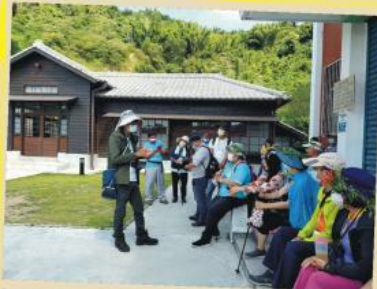
解說員向遊客導覽東山牛肉崎警察官吏派出所此臺南市定歷史建築的興建背景與重要性