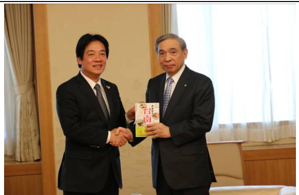
致贈介紹臺南的日文書「有趣的臺南」、「我的臺南」