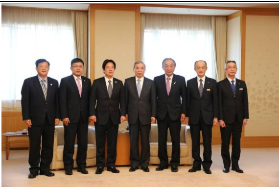
群馬縣知事及水上町長與本府參訪團合影

這兩年來透過群馬縣水上町，派遣公務員常駐臺南推動雙方合作，已達成一定功效，臺南有愈來愈多人知道群馬縣，而群馬縣對臺南也愈來愈熟悉。賴市長邀請知事一定要到臺南一遊，並致贈知事代表臺南守護神的安平劍獅交趾陶與介紹臺南的日文書「有趣的臺南」、「我的臺南」。