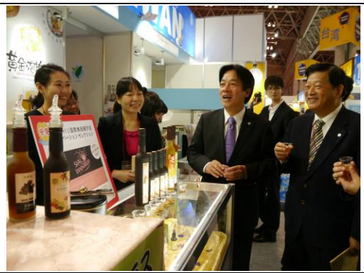
市長瞭解臺南參展情形並與廠商合影