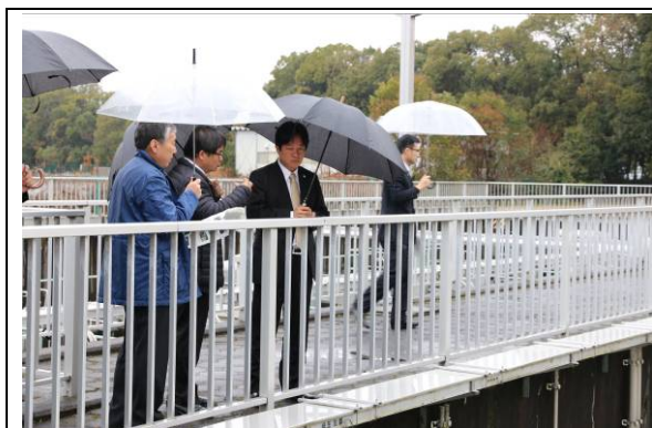
滋賀縣南中部汙水處理中心

琵琶湖是日本最大的湖，曾因遭受污染引起很大的社會問題，主要為家庭廢水，包括洗潔劑廢水污染所致。於是日本消費者團體開始推動「反合成洗潔劑運動」，在1974年，他們舉辦了「停止合成洗潔劑，為了水、生命」的全國會議，並出版文宣，提倡以肥皂取代合成洗潔劑。肥皂活動擴及地方性的草根婦女團體，有些團體甚至以家中油炸過的廢油自製肥皂。許多地方性小規模的肥皂工廠持續地增加，並向大型的合成洗潔劑工廠挑戰，最後迫使縣政府制定了「琵琶湖條例」，以管理清潔劑的使用。像這樣的案例，讓「反合成洗潔劑運動」拯救了琵琶湖，最後的美滿結局，令人省思日本人對水環境的重視。