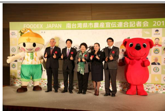
雲嘉南五縣市聯合行銷記者會合影