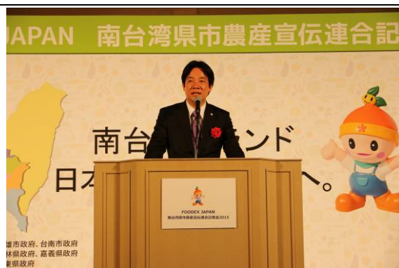
雲嘉南五縣市聯合行銷記者會 市長致詞