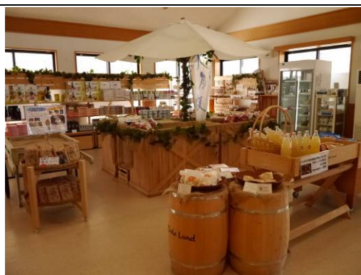
DOLE Land 農場