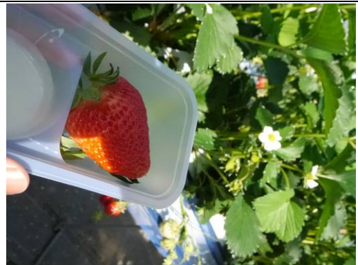
草莓溫室/採果吃到飽