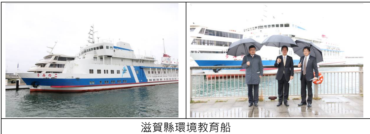
滋賀縣環境教育船

這個教育架構非常完善，不只讓小朋友從做中學，也促進學校、家庭、社區等多方面的參與與交流。透過「湖之子」這個教育學習活動，大家的心更凝聚在一起，也對琵琶湖產生更多更深的感情，更懂得關懷鄉土、人文與環境。教育是改變一切的開始，滋賀縣環保教育學習船的精神非常值得學習，臺南市也能學習此種理念，並將之運用在教育上，相信各個學校、家庭與地區的結合會更緊密，更讓人有對家鄉的認同感，也更珍惜所有資源與環境。