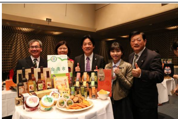
臺南農產展示區合影

記者會中以「南台灣一番」代表南台農產「美味第一、安全第一、品質第一」五縣市首長向國際宣勢嚴格把關台灣農業安全的責任與使命！記者會中，市長向日本各界媒體表示，日前台南小吃登上國際 CNN 媒體，本市農業從多元面向朝向精緻農業的目標發展，讓臺南不僅只是府城，更從文化美食古都的底蘊出發，成為臺灣安心美味的食材基地！我們期望不僅以農業美食與世界連結，結合觀光城市行銷，創造更大效益。