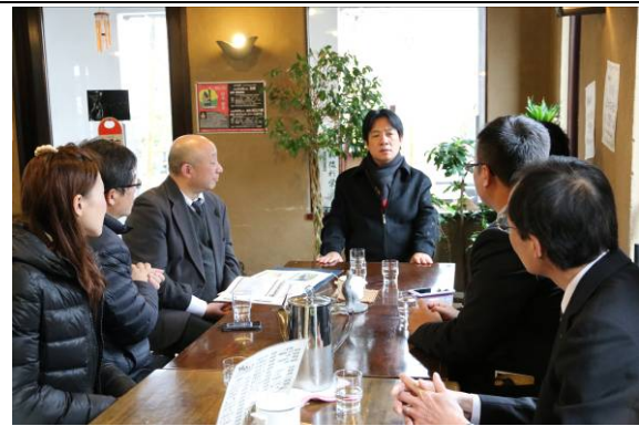
滋賀 NGO 團體向市長說明環境再生過程