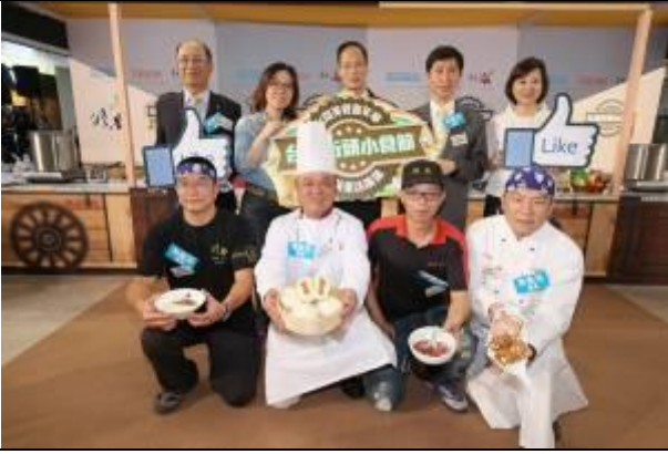
現場貴賓與 4 家臺南美食業者合影