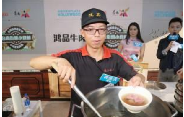
主持人逐一介紹臺南美食-鴻品牛肉