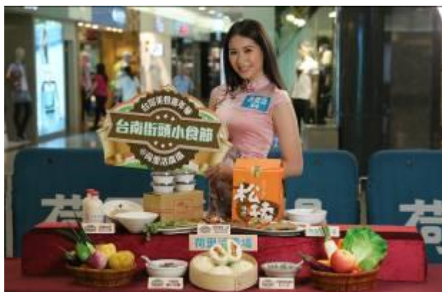
模特兒與 4 家美食合影(宣傳照)