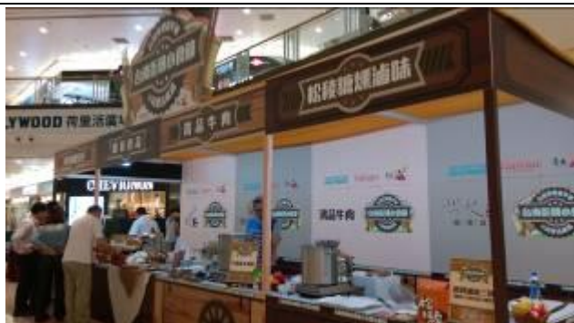
記者會前準備-業者