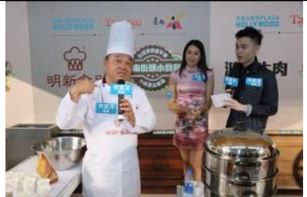
主持人逐一介紹臺南美食-明新食品