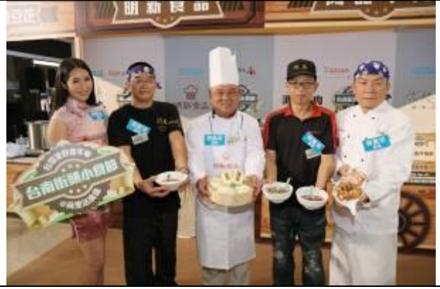
媒體拍攝活動宣傳照