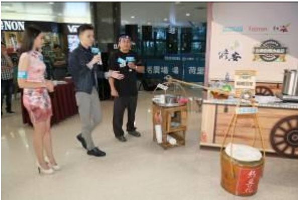
主持人逐一介紹臺南美食-修安扁擔豆花