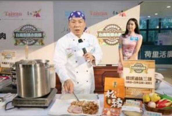
主持人逐一介紹臺南美食-松稜滷味