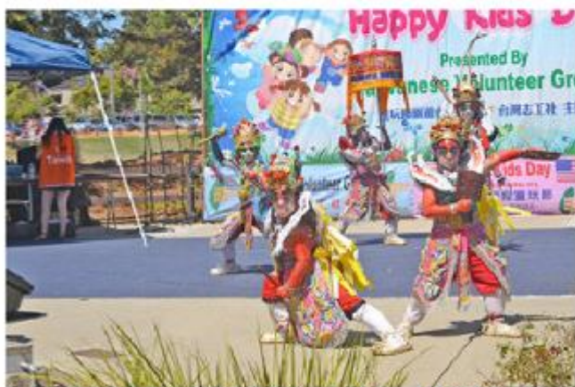
台南那拔小學小朋友在童玩節開幕式上表演。

August 24, 2014 06:00 AM | 221 次 | 0 評論 | 14 讚 | 0 收藏