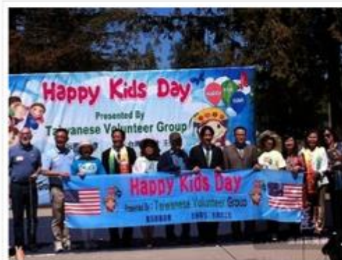
出席第5屆金山灣區國際童玩節的貴賓合影。

由台灣志工社主辦的第5屆國際童玩節（Happy Kids Day）23日在Cupertino Memorial Park盛大舉行，今年會場分主舞台區、美食區、國際文化館、台灣體驗區、台灣姐妹市，國際文化館共邀請台灣、牙買加、越南、墨西哥、祕魯等8個國家參與，表演非常多元化。重頭戲由台南市那拔國小的傳統廟會陣頭八家將演出擔綱，不僅最吸引觀眾目光，也將台灣廟會文化發揚光大，並邀請電音三太子、日本大鼓及印度舞等多國的表演，活動好玩、好看又好吃，吸引數千個各族裔家庭帶著孩子一起同樂。