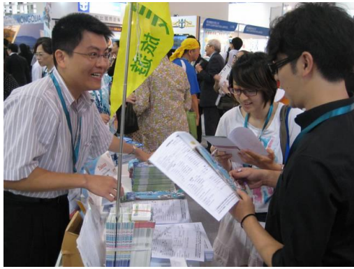
參訪民眾旅遊諮詢