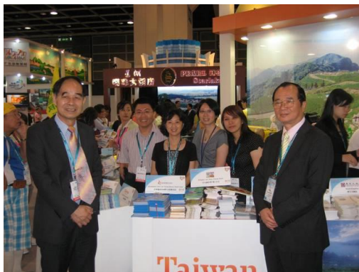
與香港辦事處主任合影