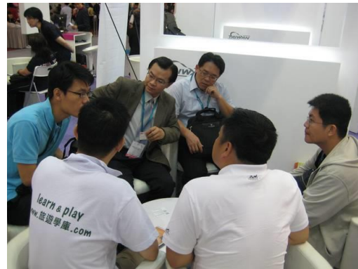
與在地業者洽談