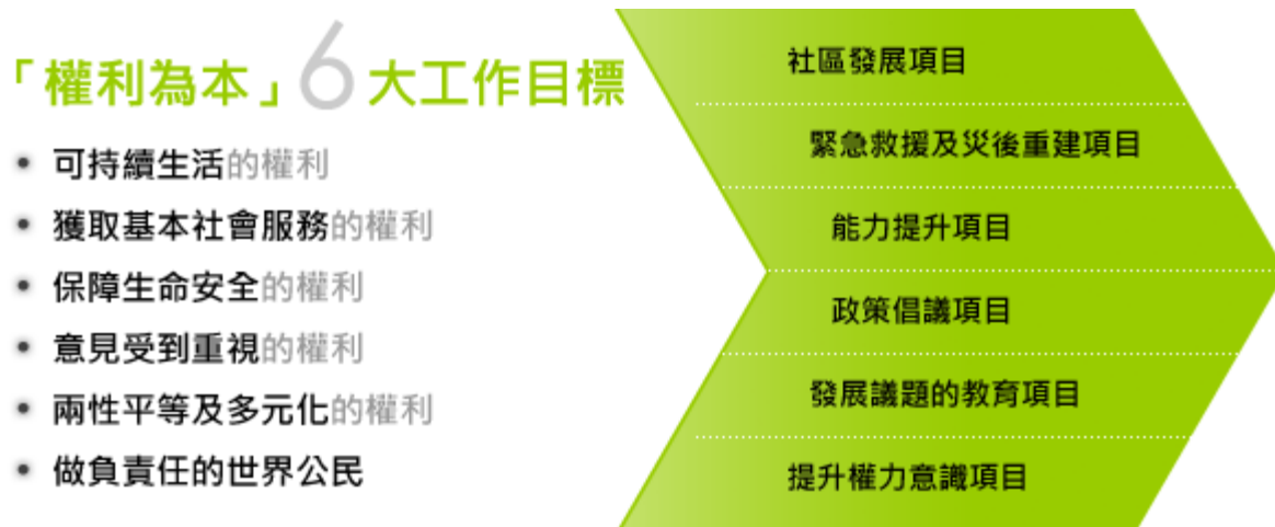
圖表：「權利為本」的工作目標

樂施會的六大工作目標包括實現可持續發展的生計、進行緊急救援及災後重建工作、政策倡議活動及有關發展議題的教育工作等。我們按不同的工作目標設立多元化項目，從而消滅貧窮，並致力根除引致貧窮的複雜成因；而每個扶貧項目均根據以上六項權利的原則來設計與執行。