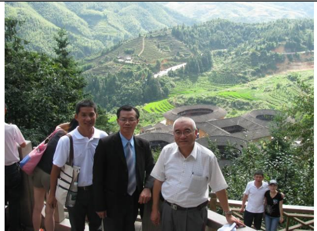
參訪南靖田螺坑土樓群