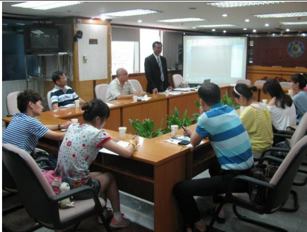
拜訪廈門市旅遊局及與在地 outbound 旅遊業者進行座談