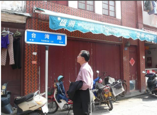
步行於漳州鄉城區