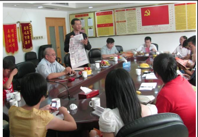
拜訪泉州市旅遊局及與在地 outbound 旅遊業者進行座談