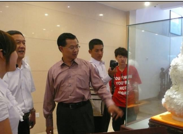
參訪錦繡莊民間藝術園