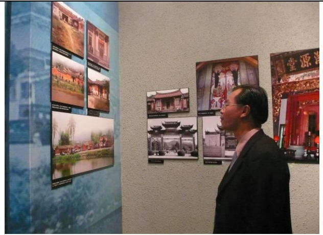
參訪泉州海外交通史博物館