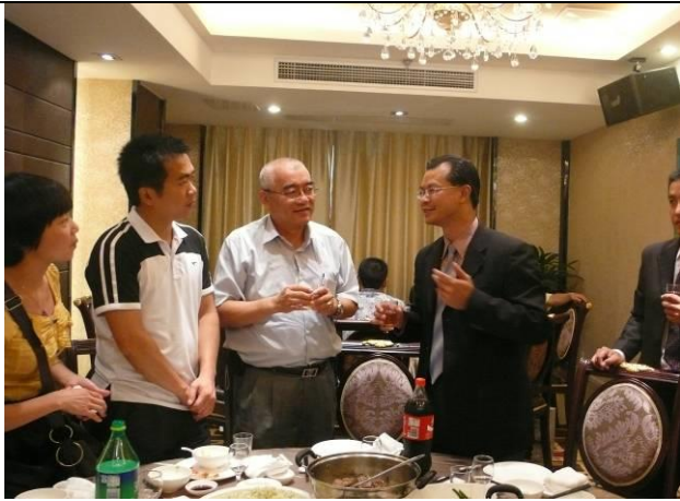
本局宴請泉州市旅遊局 及在地 outbound 旅遊業者