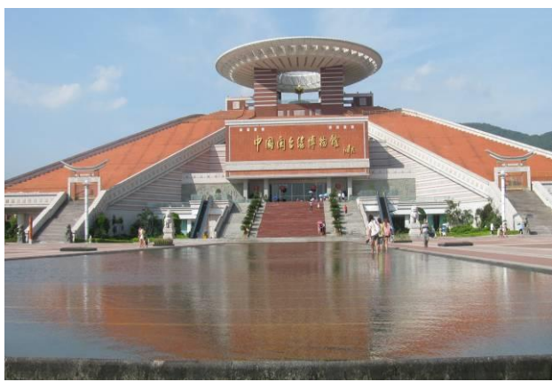
參訪中國閩台緣博物館