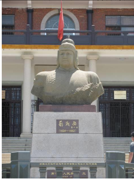
參訪泉州石井鄭成功紀念館