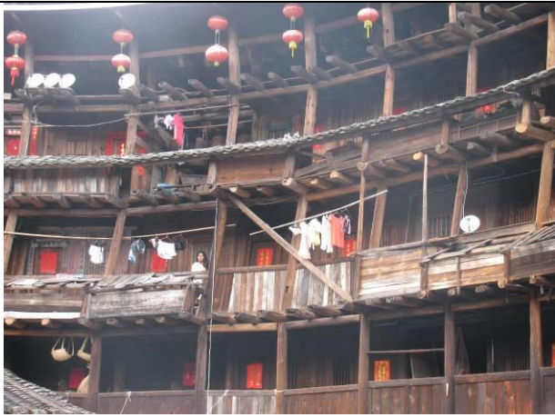
參訪裕昌特色土樓