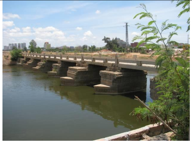
參觀鄭成功故居南安市之安平橋