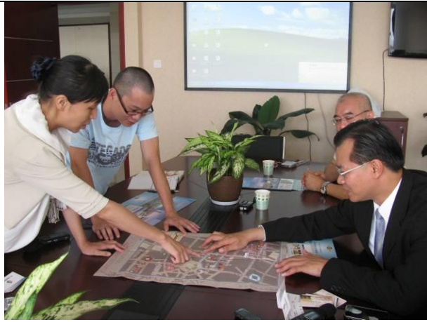
拜訪廈門山海樹新城投資有限公司