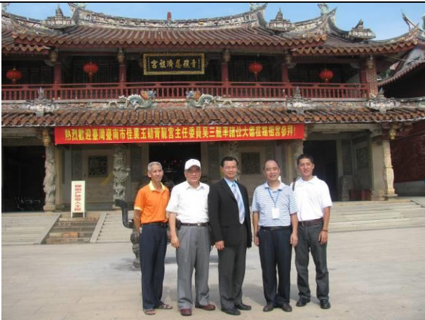
參訪廈門青礁慈濟宮