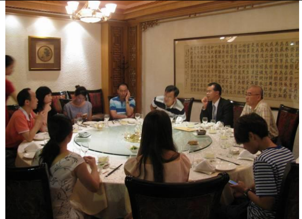
本局宴請廈門市旅遊局及在地 outbound 旅遊業者