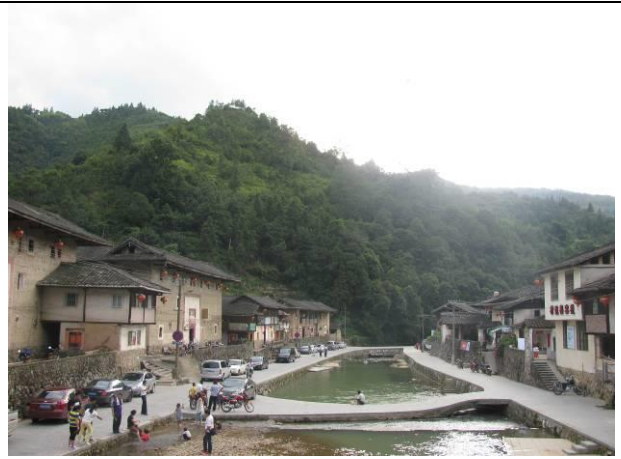
參訪塔下村傳統聚落