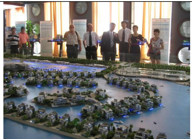
參訪廈門香山國際遊艇碼頭