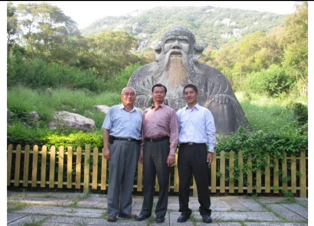
參訪清源山老君岩