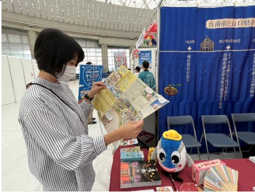
現場民眾認真翻閱臺南觀光摺頁