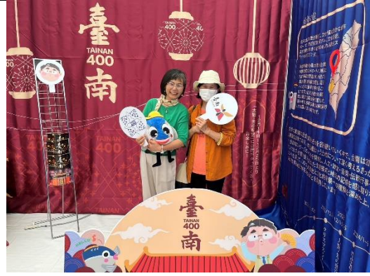
民眾拍照區拍照留念