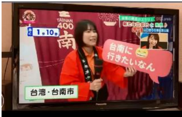
yab 山口朝日放送節目直播