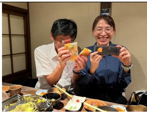
交流期間雙方互相介紹觀光特產