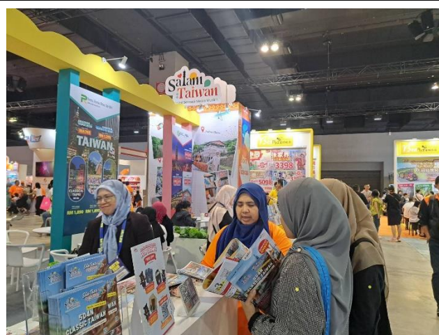
臺灣館清真旅遊專區