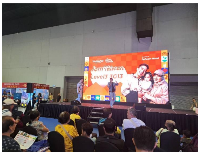
百萬穆斯林帥哥網紅 As'ad Motawh