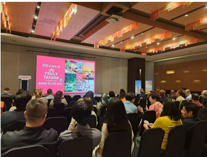
本府簡報臺南觀光資源