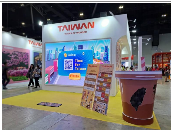
臺灣館珍珠奶茶造型布置