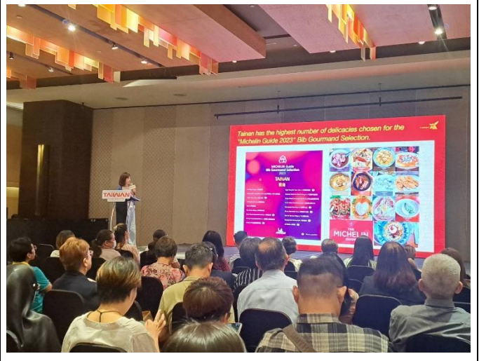
本府簡報臺南米其林美食之都