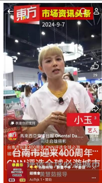
大馬旅遊網紅小玉熱情直播