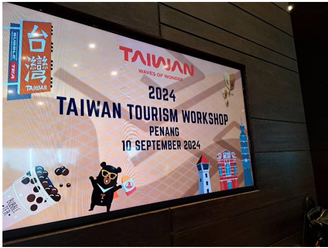
檳城臺灣觀光推介會