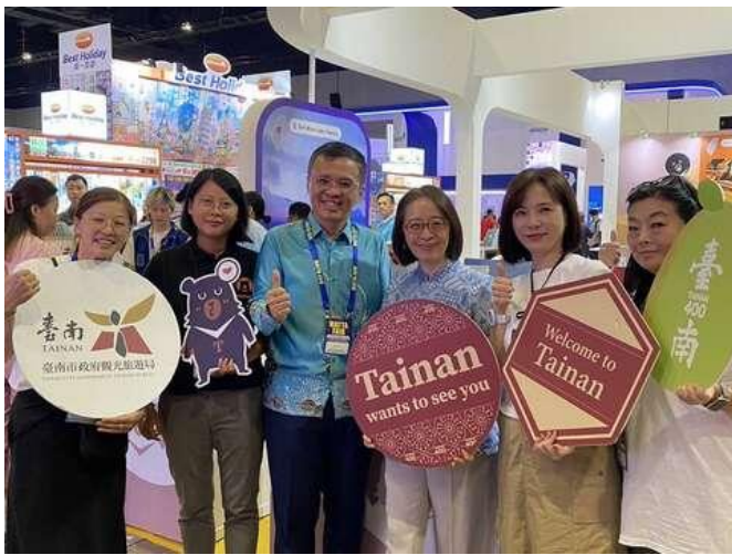
葉菲比大使蒞臨臺南展攤推介