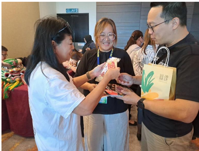
贈送伴手小禮與業者交流