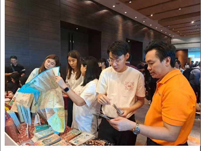
向檳城旅遊同業介紹臺南景點資源