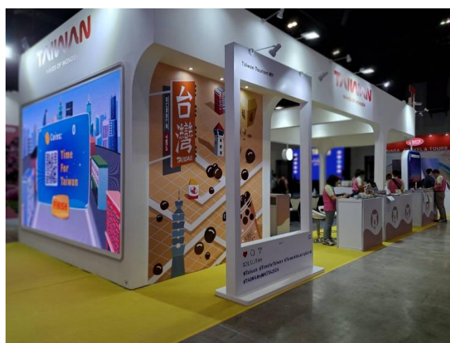
臺灣館打卡框造型布置