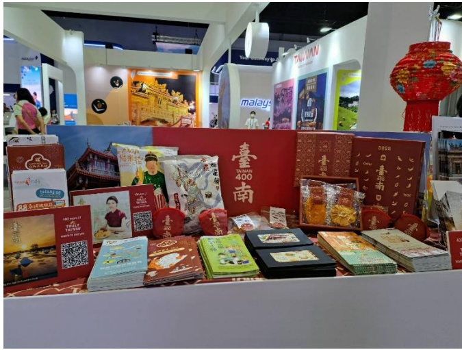
臺南展攤主題鮮明 豐富吸睛