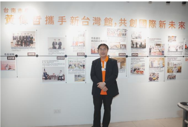
圖 27：新台灣館現場擺設市長赴新加坡推廣臺南農特產品及觀光旅遊之年度里程碑。