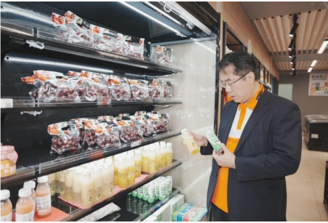
圖 25：市長參觀新台灣館現場展售。