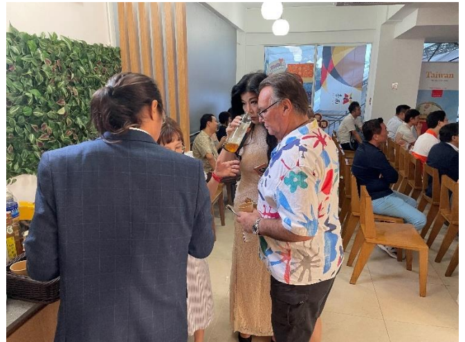
圖 15、圖 16：新加坡在地供應商參觀文創商品、農特產品及臺南旅遊特色