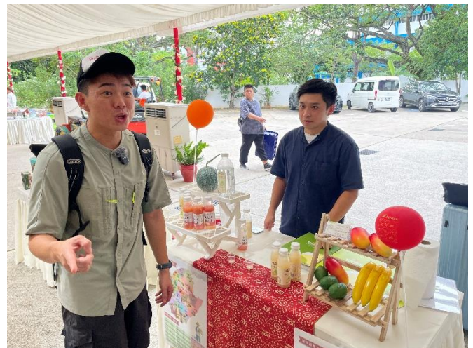
圖 22：HongisBored 影音創作者，拍攝宣傳綠園牧場。