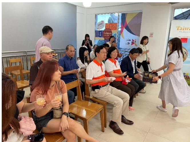
圖 13：麻豆區農會發送文旦柚子汁試飲