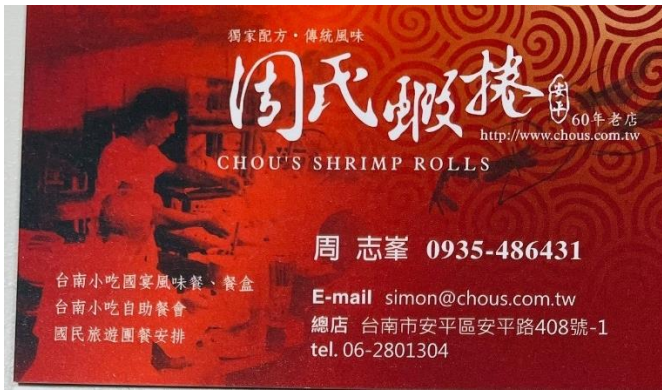
圖 37：周氏蝦捲 周志峯 董事長 (臺南品牌業者)