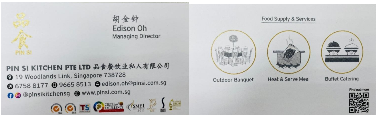
圖 36：品食餐飲 胡金鍾 常務董事