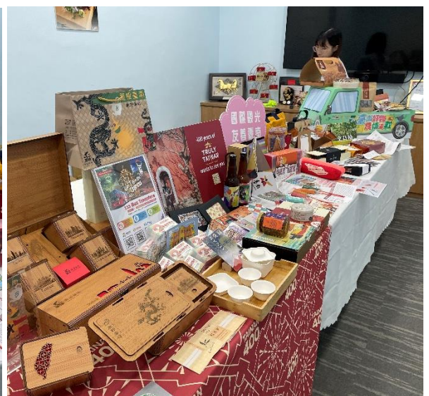
圖 9、圖 10：擺設臺南旅遊資訊(111 臺南小港機場巴士、新加坡限定臺南旅遊卡)及臺南 400 文創商品