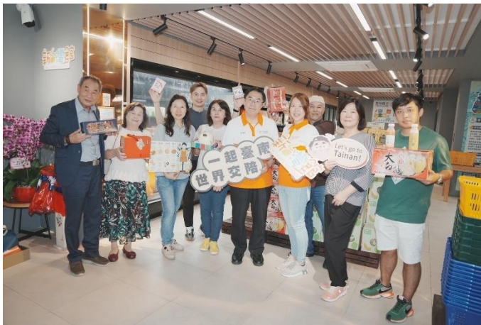
圖 3：新台灣館開幕活動-黃偉哲市長與業者大合照