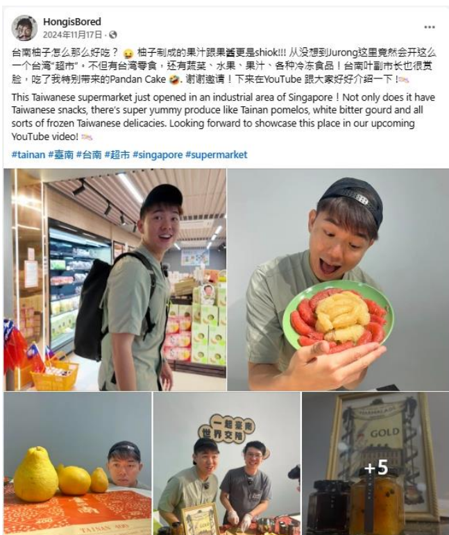
圖 23：HongisBored 影音創作者臉書專頁宣傳臺南特色物產及旅遊資訊。