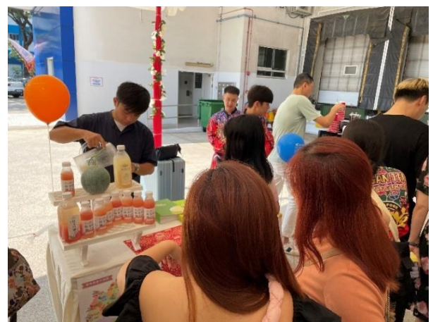
圖 6：新台灣館開幕活動-綠園牧場提供飲品試飲