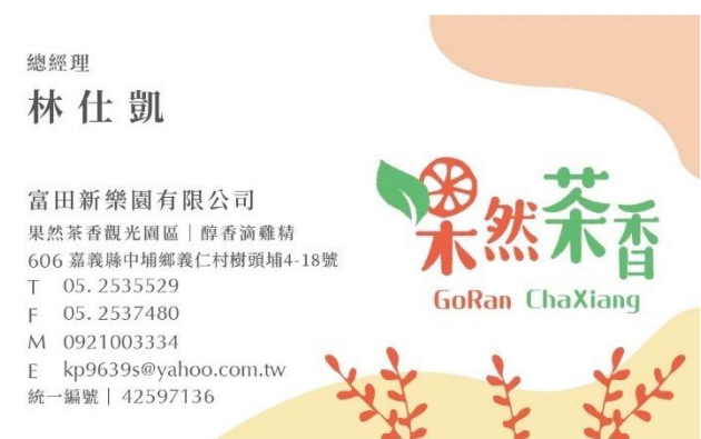
圖 40：果然茶香 林仕凱 總經理 (新台灣館開幕之協力業者)