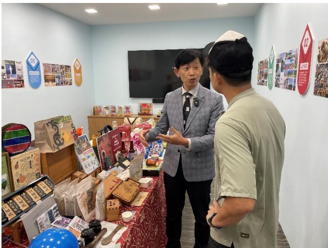
圖 21：HongisBored 影音創作者，拍攝葉副市長介紹臺南旅遊資源。