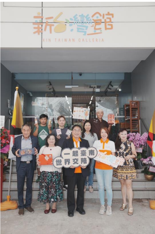
圖 29：市長與新台灣館店長及業者一同合照。