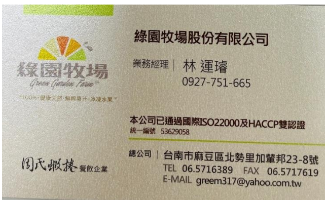
圖 39：綠園牧場 林運璿 業務經理 (臺南品牌業者)