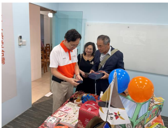
圖 12：古寶無患子業者王董事長向駐新加坡台北代表處童振源大使介紹產品特色