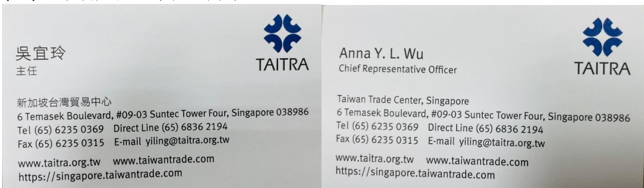
圖 32：新加坡台灣貿易中心 吳宜玲主任