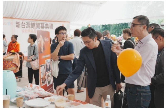
圖 4：新台灣館開幕活動-周氏蝦捲提供美食試吃