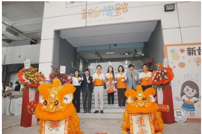
圖 2：新台灣館開幕典禮-祥獅獻瑞儀式