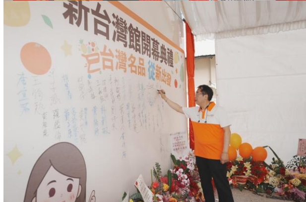
圖 31(下)：市長於開幕典禮紀念版上簽名紀錄。