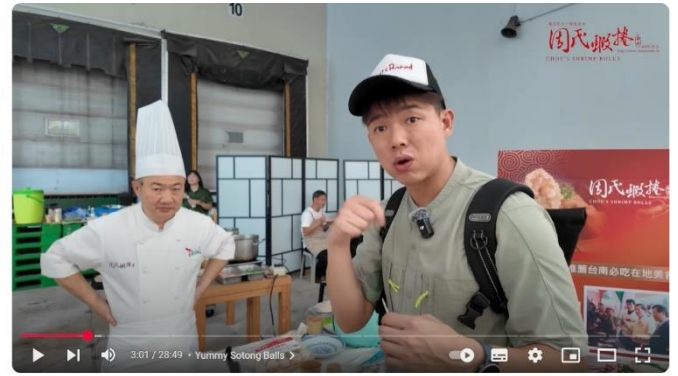
We Visited A Hidden Taiwanese Supermarket in Jurong Industrial Area! 隱藏在裕廊的台灣超市 HongisBored 訂閱 1290 分享 下載