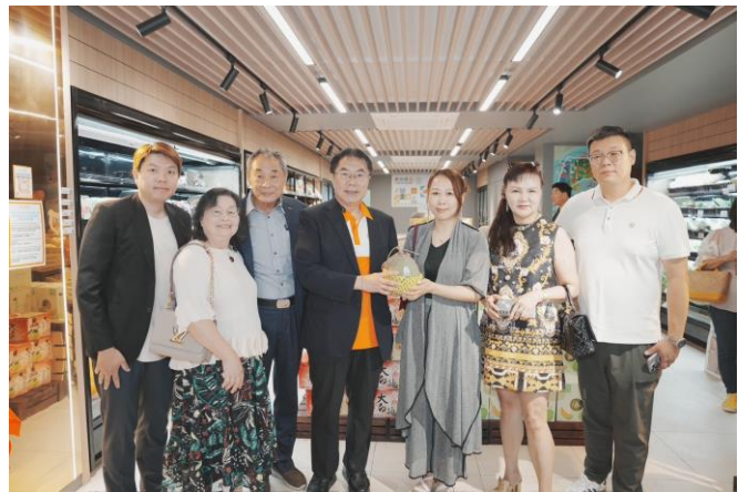
圖 28：市長與新加坡在地業者合照。