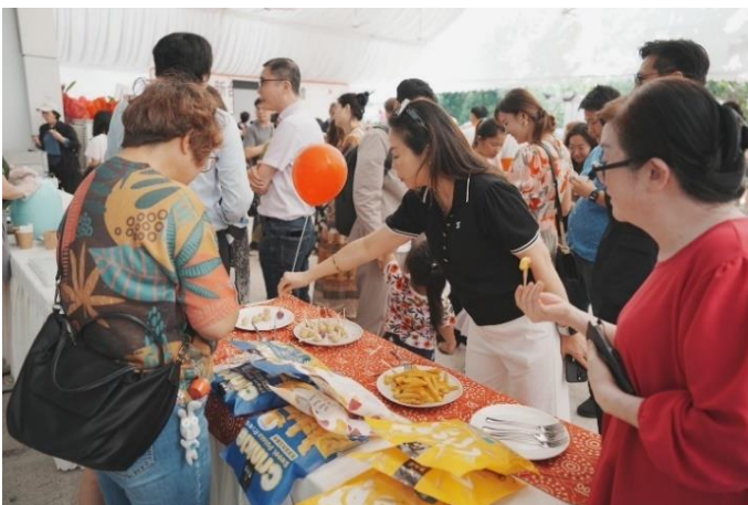
圖 5：新台灣館開幕活動-瓜瓜園提供美食試吃