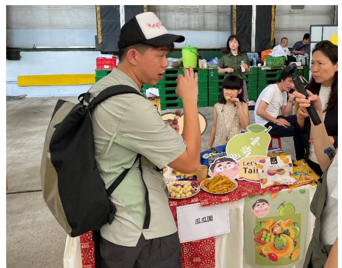
圖 24：HongisBored 影音創作者，拍攝宣傳瓜瓜園。