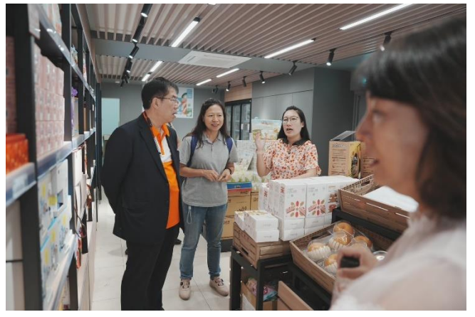
圖 26：主辦單位向市長介紹新台灣館規劃。