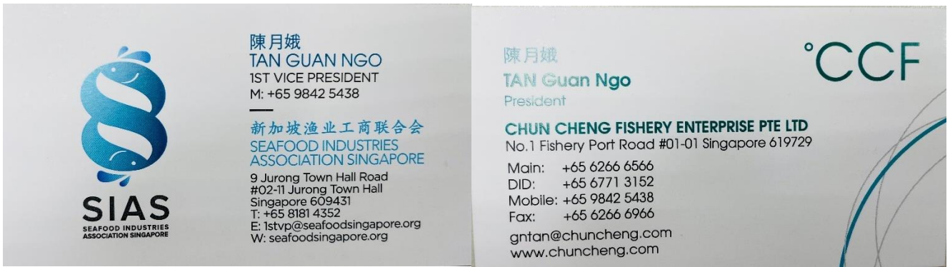
圖 33：新加坡漁業工商聯合會 陳月娥 副總