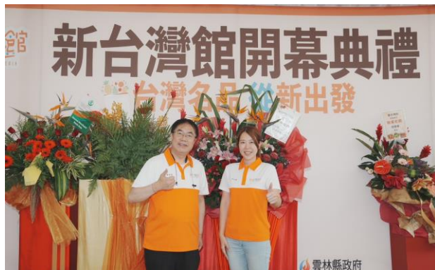
圖 30(上)：市長與新台灣館店長一同合照。