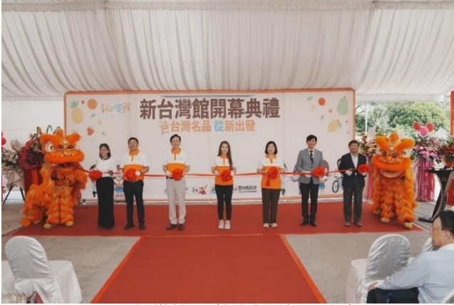
圖 1：新台灣館開幕典禮剪綵儀式

由新加坡最大水產貿易商 Yoshimura Food Holdings Asia CEO 一手打造的「新台灣館」於 113 年 11 月 16 日上午 10 時整進行開幕活動，為新加坡首座專門展售臺灣產品的海外中心，該館販售來自臺南等臺灣 22 縣市的得獎產品及地方特產等等。現場開幕活動，規劃包含來自臺南市政府、嘉義縣政府、雲林縣政府等城市的產業業者於現場進行烹飪示範並提供試吃活動，共計 6 個攤位，其中安排臺南業者計 3 個攤位，包含周氏蝦捲大廚製作蝦捲、瓜瓜園烹飪地瓜夾心球，以及綠園牧場以臺南盛產水果所製成的飲品冰沙等在地知名熱門美食飲品，提供現場民眾試吃。