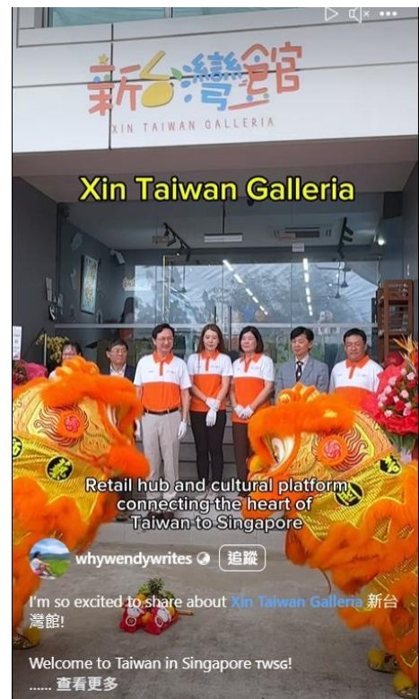
圖 8：新加坡知名直播主- whywendywrites