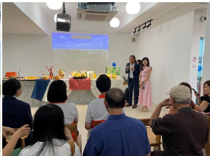
圖 14：麻豆區農會現場進行食農教育推廣臺南物產特色