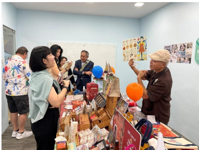
圖 11：赤崁糖業者向新加坡青商會代表介紹產品

本府準備豐富「臺南 400」文創商品，包含永良老頭家、赤崁糖、古寶無患子、周氏蝦捲、綠園牧場、甜玉軒、鹿野茶行、度小月及黑橋牌食品等，臺南市長黃偉哲精選眾多臺南好物帶到「新台灣館」的開幕式，以及本市麻豆區農會孫慈敏總幹事及柚農於現場進行食農教育，向新加坡供應商或相關單位展示本市農特產文旦，並現場提供試飲，由文旦製成的飲品，豐富的臺南物產特色，吸引新加坡民眾將可零距離隨時採購臺南的農特產品及伴手禮，本局現場準備新加坡限定「臺南旅遊卡」以及多款本市觀光遊文宣摺頁，一同提供現場參觀民眾索取，擴大宣傳臺南旅遊話題曝光度，期能進一步提升本市觀光旅遊市場產值。