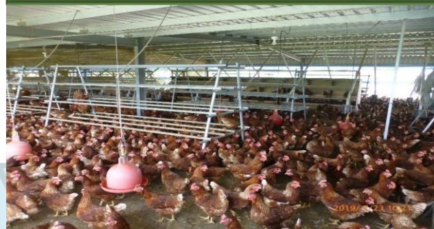
家畜潛在設置場數93場