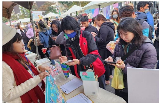
海安商圈-虎翔x2024 聖誕市集 119攤