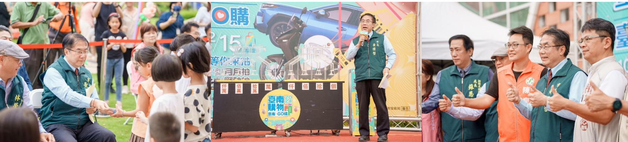
11/23 GO購童樂會 執行成果