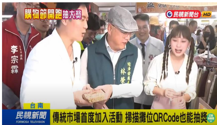
公有零售市場、夜市1638攤