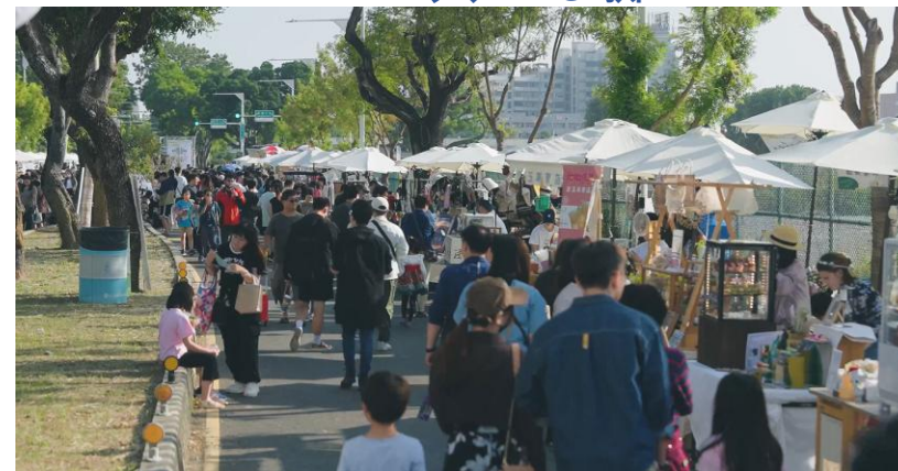
大東橋商圈-聖誕音樂城102攤