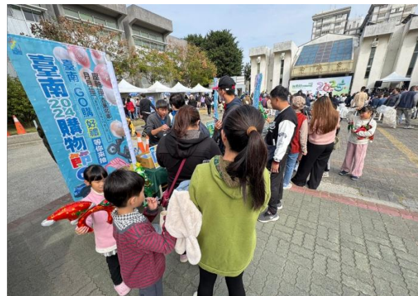
新聞處耶誕跨年系 列活動250攤