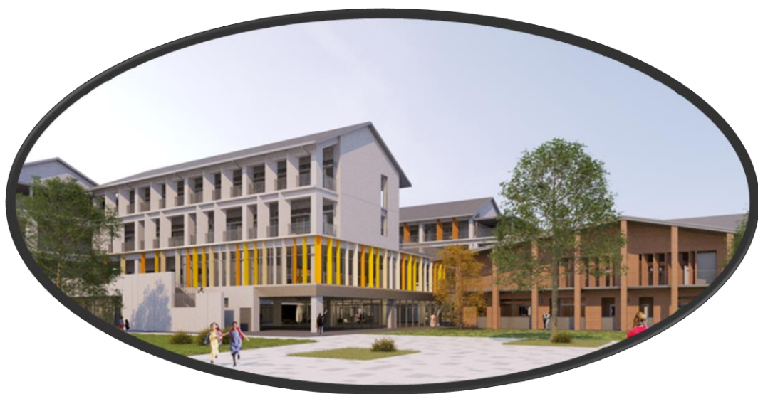
臺南市立沙崙國際高級中等學校 Tainan Municipal Shalun International High School