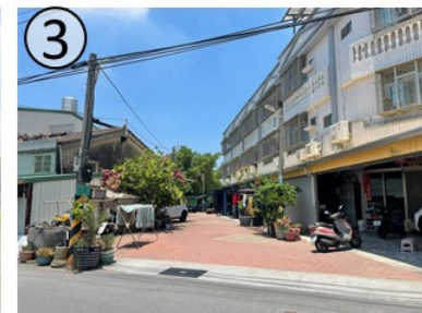
工程範圍現況示意圖