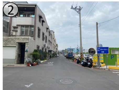
工程範圍現況示意圖