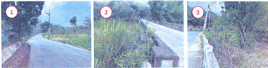
工程範圍現況土地使用情形示意圖