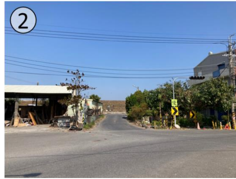
工程範圍現況示意圖