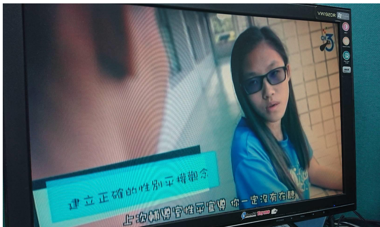
校園性平微電影播出畫面