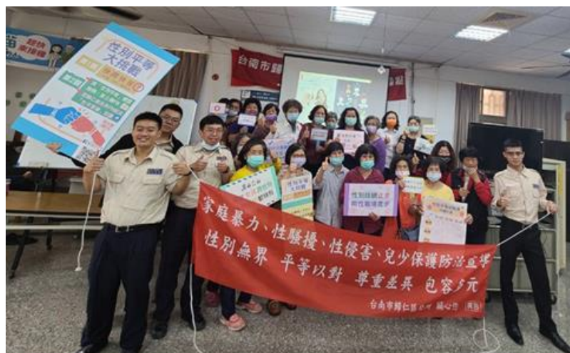
照片說明：活動圓滿結束，參與人員大合照。