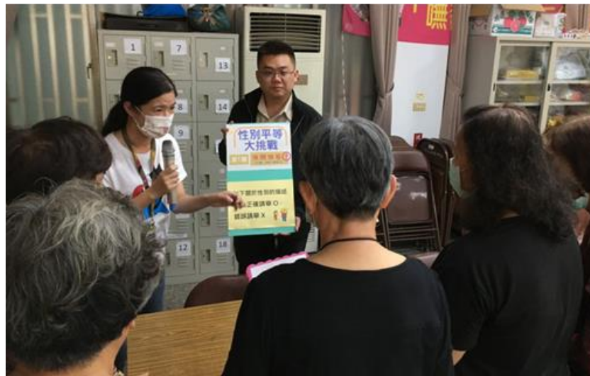
照片說明：性別平等大挑戰第一關：快問快答，民眾分組回答問題搶分。