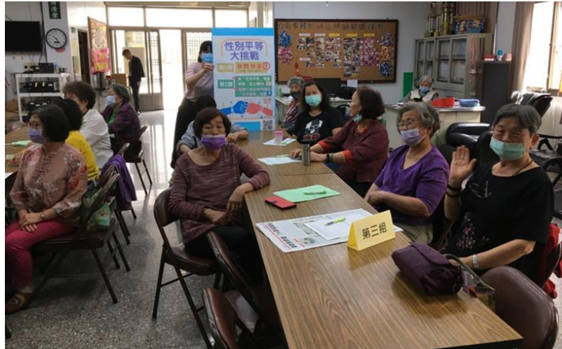
照片說明：現場民眾分組參加性別平等大挑戰。