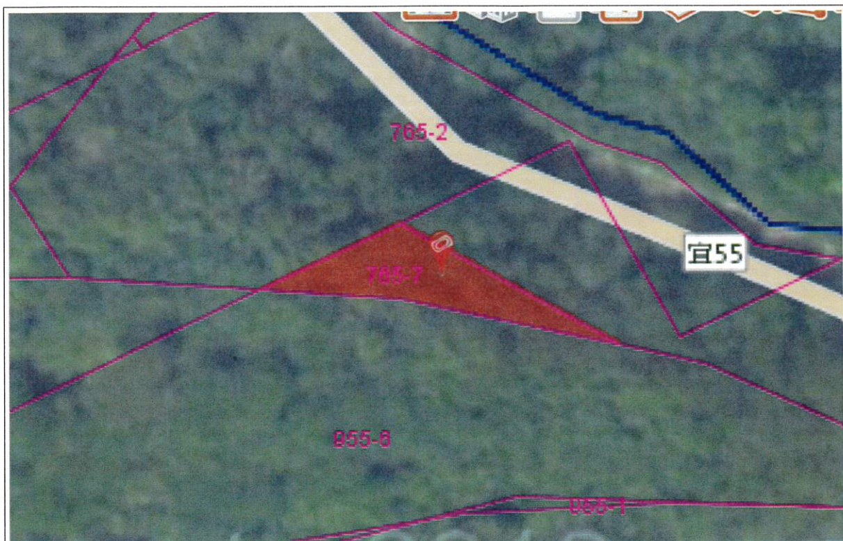
鹿皮段 765-7 地號