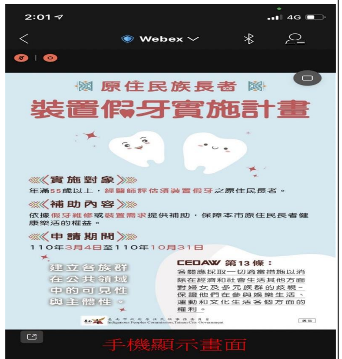
本會自製媒材電子海報宣導