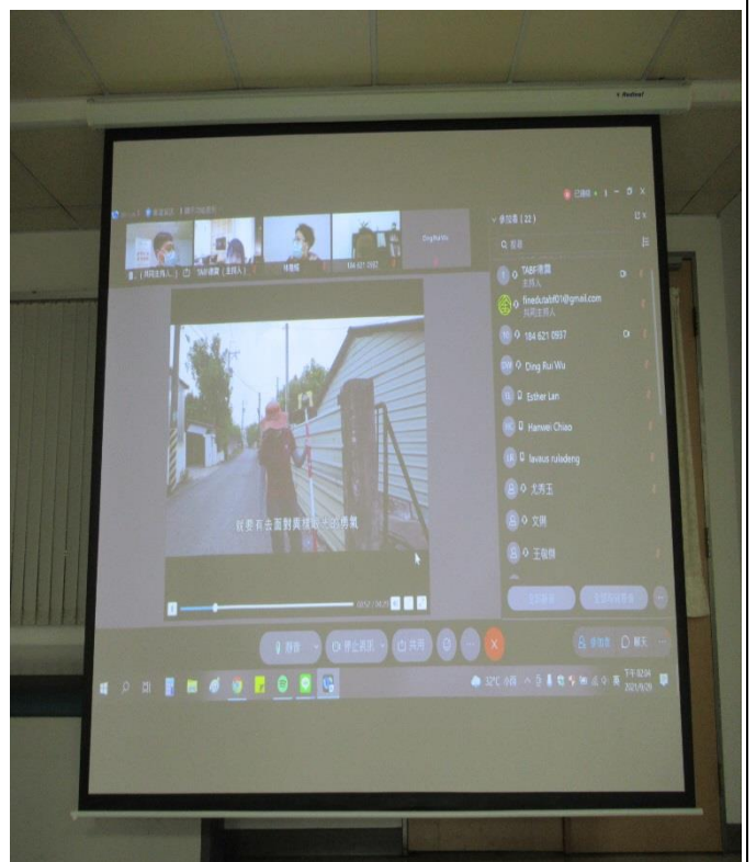
線上講座開始前播放性平影片宣導