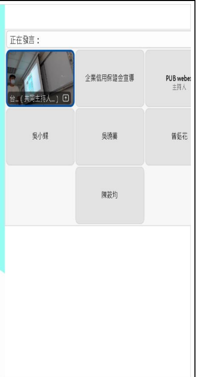
本會自製媒材電子海報宣導