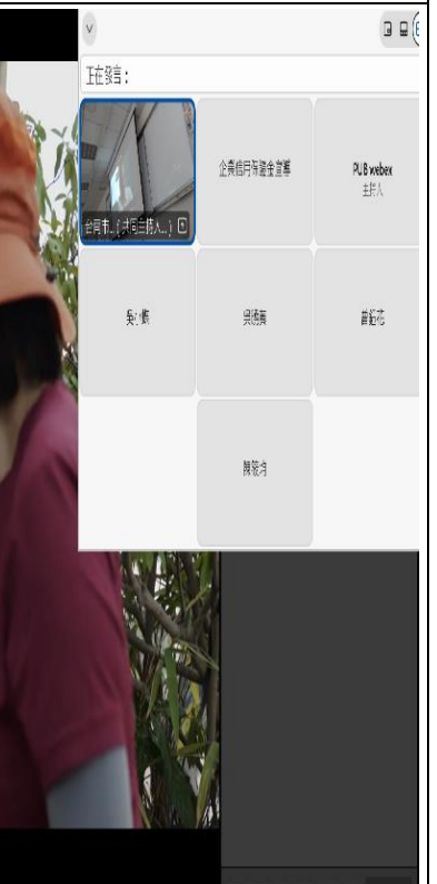
講座開始前播放性平影片宣導