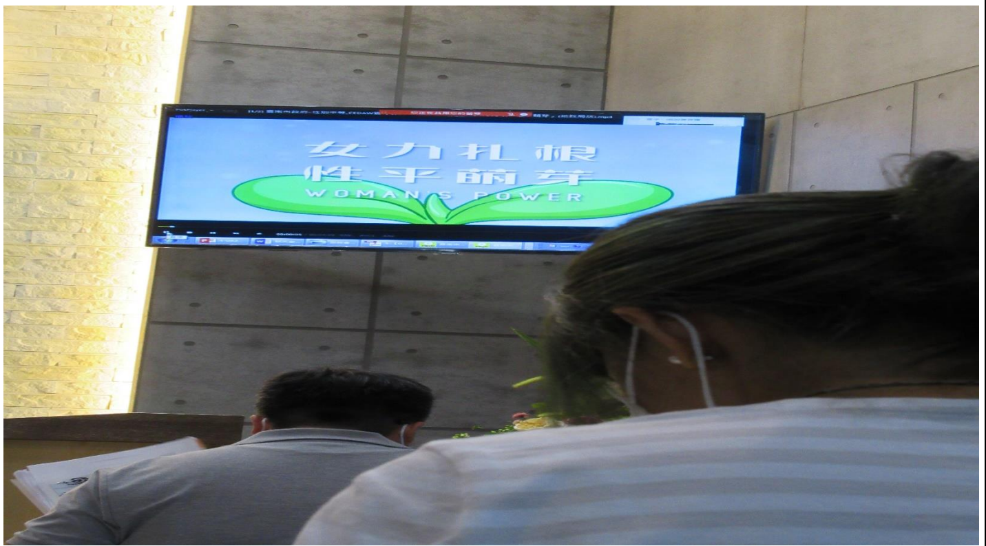
講座開始前播放性平影片宣導