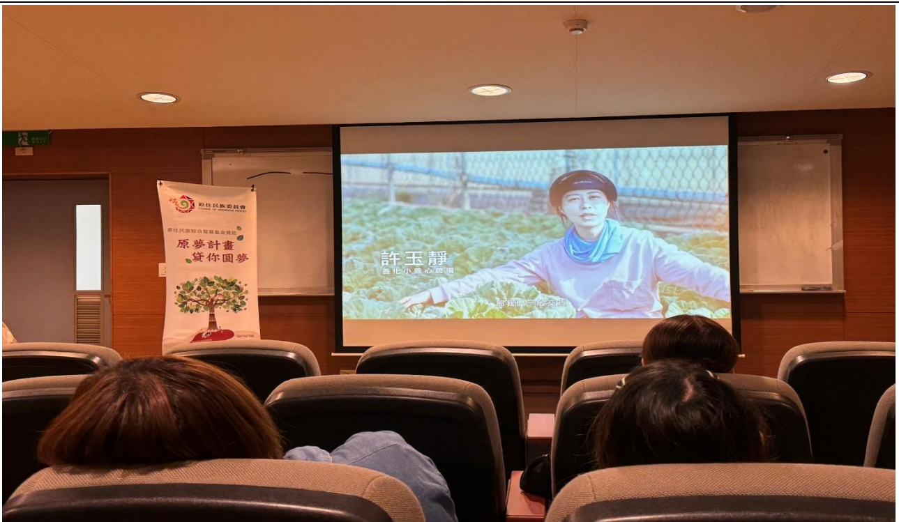
講座開始前播放 CEDAW 影片宣導