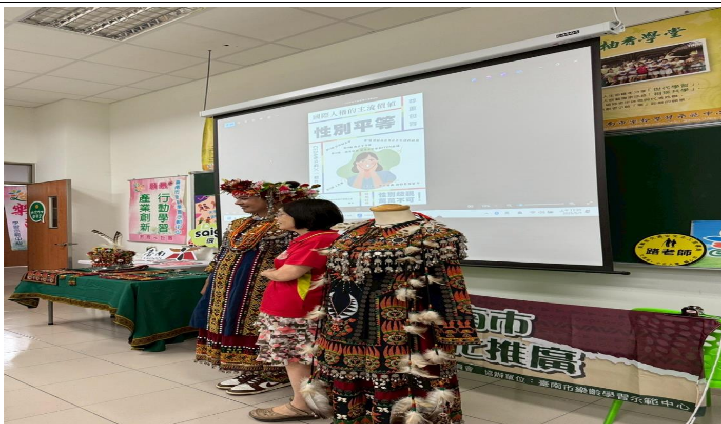
自製媒材電子海報宣導