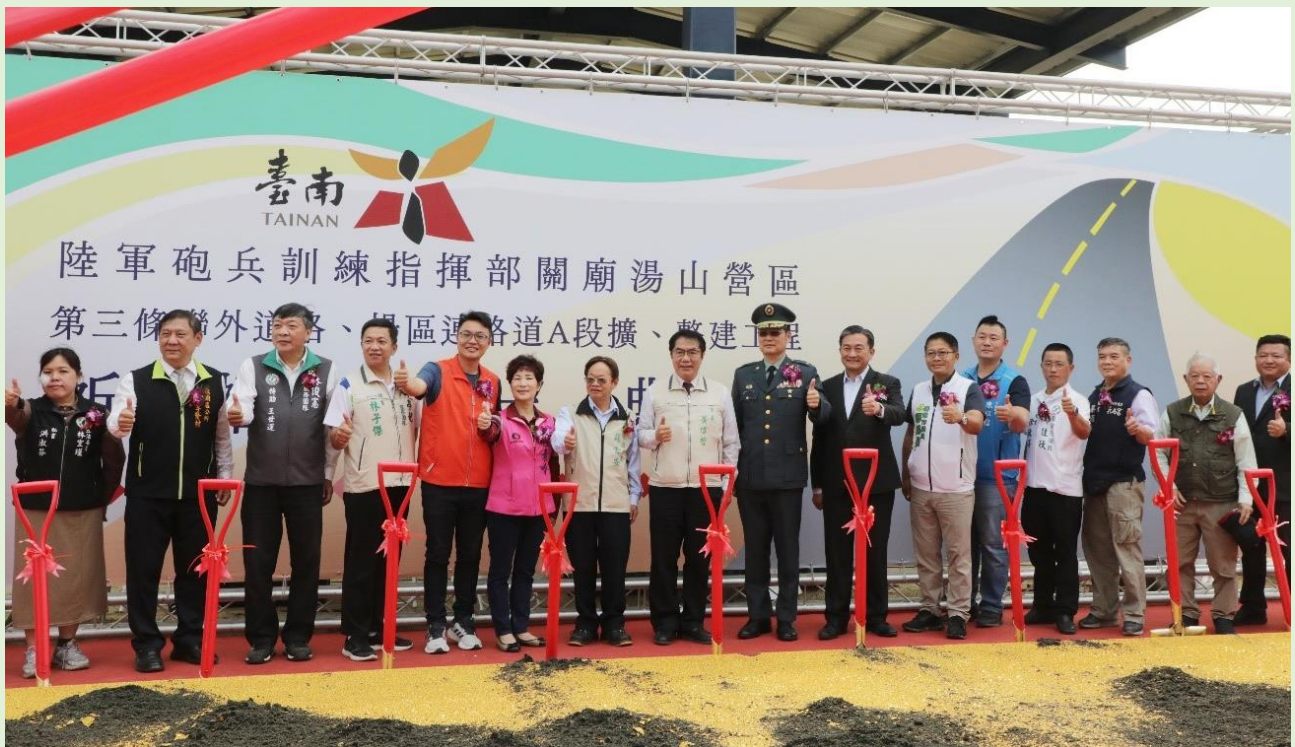
照片 2、動土儀式順利

工務局表示，此案工程經費約 5.76 億元 ( 含用地費 1.15 億元 )，其中，新闢第三條聯外道路起點位於台 19 甲線保東國小旁(關新一街)，沿路經埤子頭埤、名度金寶塔經國道 3 號跨越橋至關廟湯山營區西北側與校區道路銜接，道路預計全線拓寬為 8 公尺(含兩旁側溝)，長 2.9 公里。另外，場區連絡道 A 段主要作為湯山營區、新虎山訓練場、夕陽峰陣地、訓練場地 1、訓練場地 2 及訓練場地 3 之往來交通要道，以既有產業道路拓寬為 8 公尺(含兩旁側溝)，長 4.9 公里。兩項工程路段合計擴建長度約 7.8 公里，工期 750 日曆天，本案已於 112 年 4 月 6 日開工，預計 114 年 5 月完工通車。