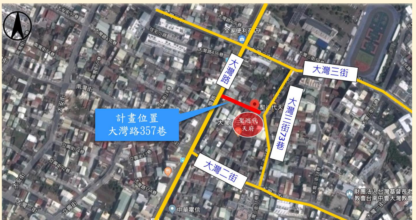
照片 3、永康區大灣路 357 巷位置圖