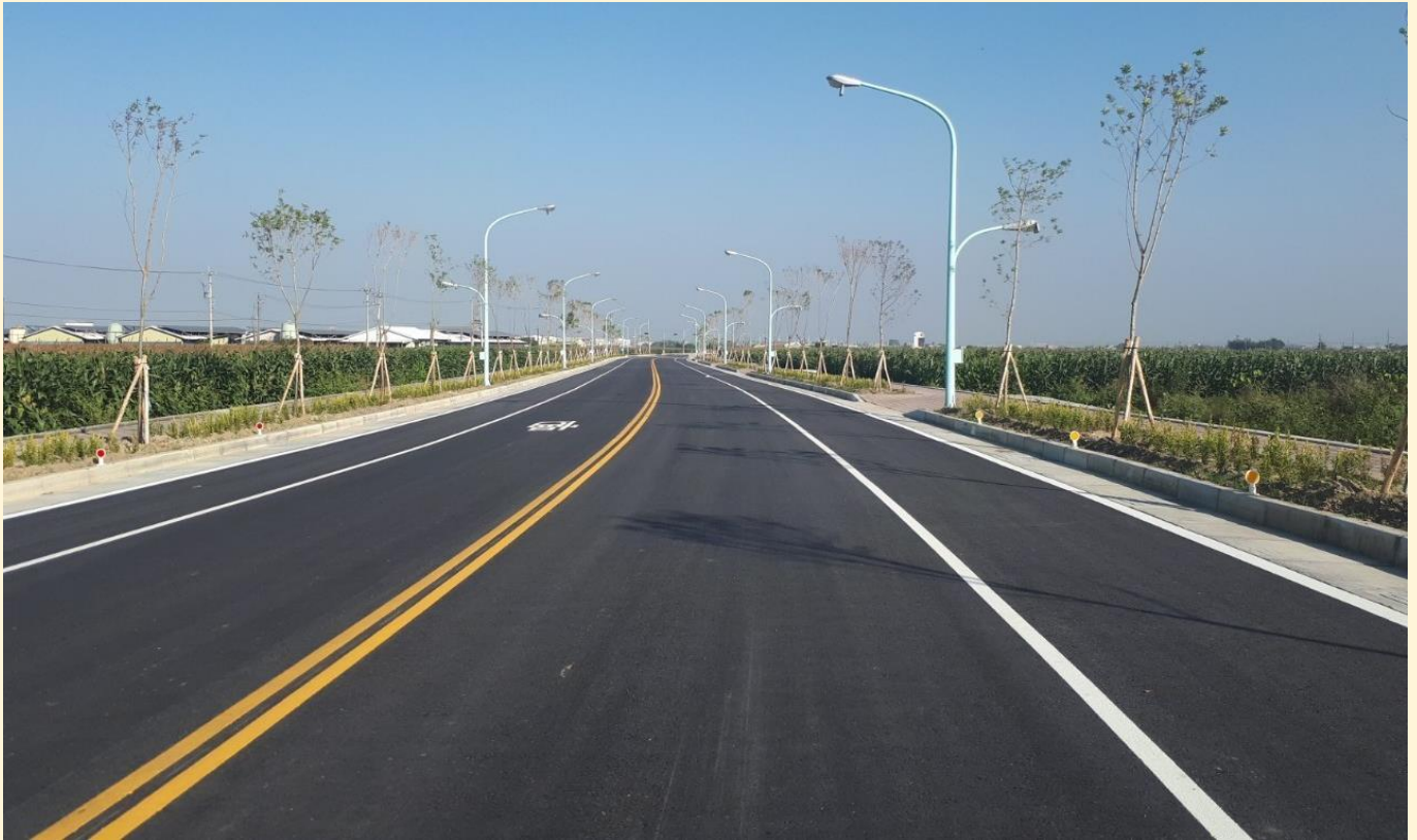
照片 2、下營南外環道路完工照

尺、(含兩側人行步道)。銜接下營北外環市道 174 線，向南經過大埤社區後轉向東直行，橫交行經南 56-1、南 59、中山路、大埤中排水、下營排水及急水溪排水等處後銜接東側外環道臺 19 甲線。可避免過境車流進入下營市區，由外環道迅速通往臺 84 線下營交流道等地。