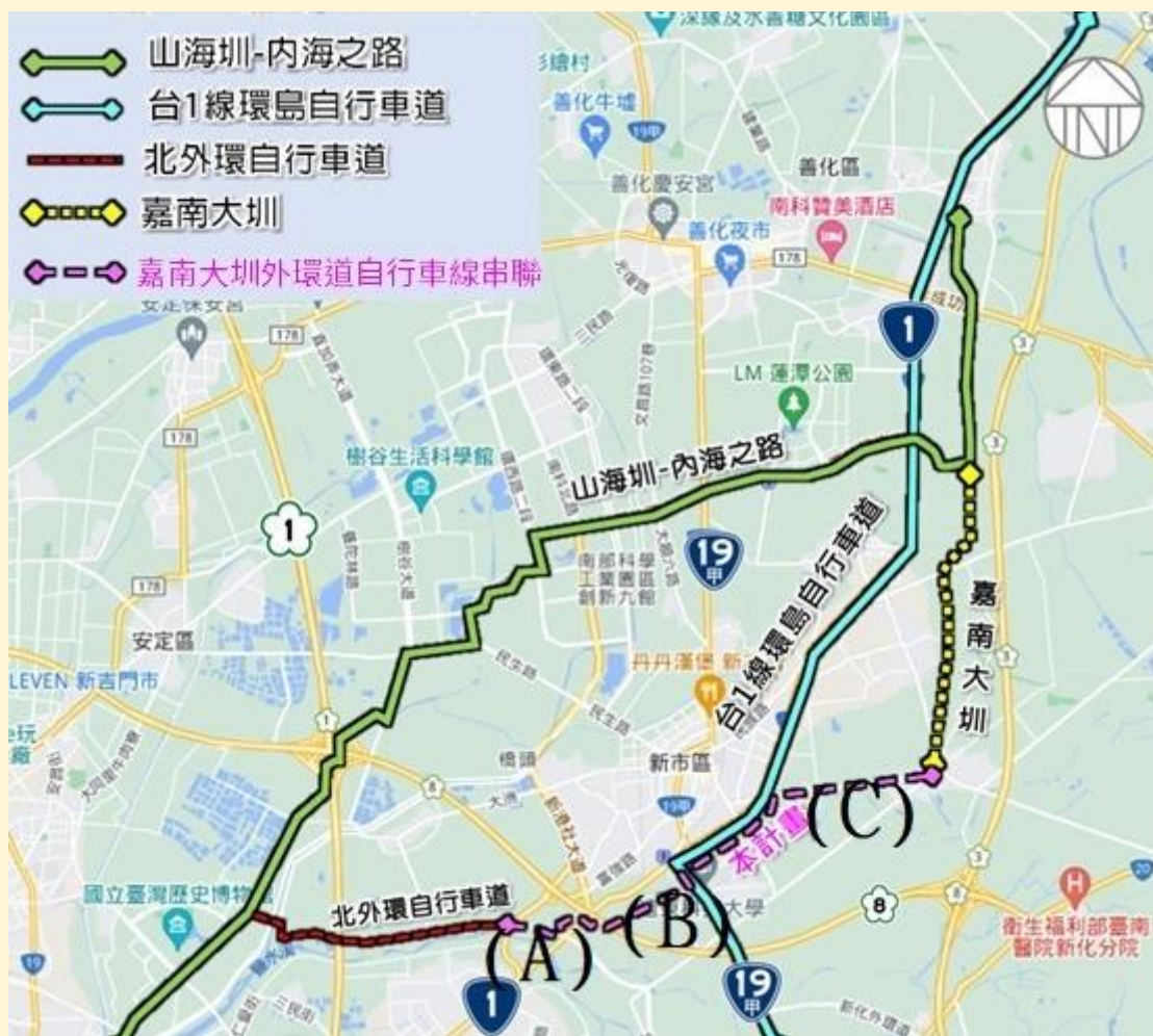
照片 1、臺南都會區北外環道路東行已有自行車與人行道共線

「大南方、大發展」是蔡英文總統提出，發展大南方科技廊帶作為南台灣發展計畫，南部科學園區更是半導體產業發展核心之一。台南市政府爭取南科周遭的衛星工業區聯合發展，其中，位於南部科學園區東側的山上工業區對外聯絡道路，更攸關連接南科路廊，加值提升工業區服務機能與形象。為此，臺南市長黃偉哲積極爭取山上工業區「直達南科西拉雅道路新闢工程」及「嘉南大圳外環道(南138線-北外環)自行車線串聯」等2大工程，日前經內政部同意核定，納入111-116年度生活圈道路建設計畫補助，總經費近10億元，對推升南科路網發展及產業串連，效益甚大。