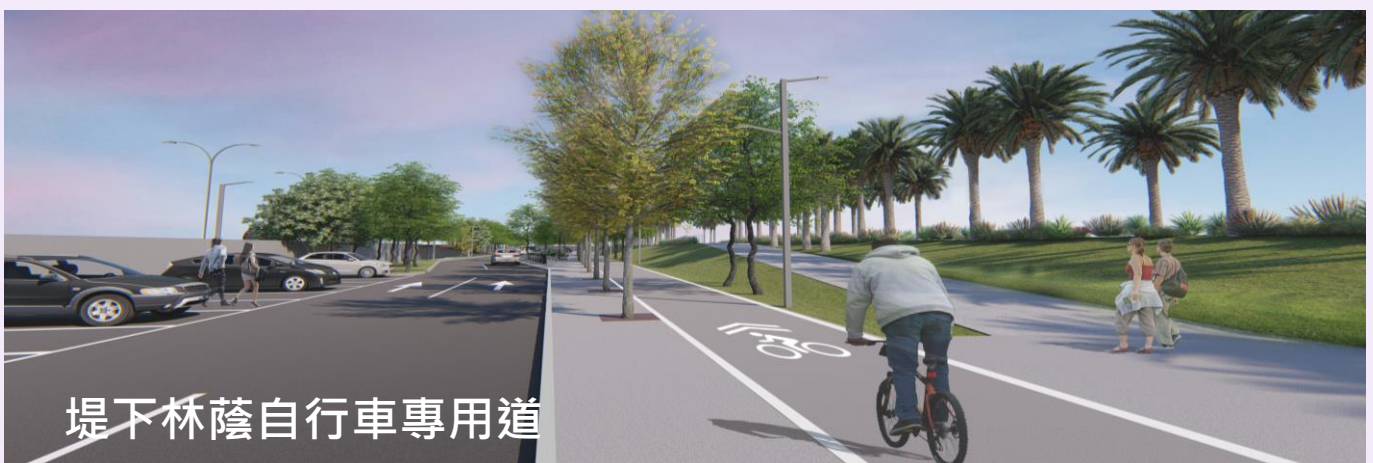
照片 4、公園闢建後自行車專用道示意圖