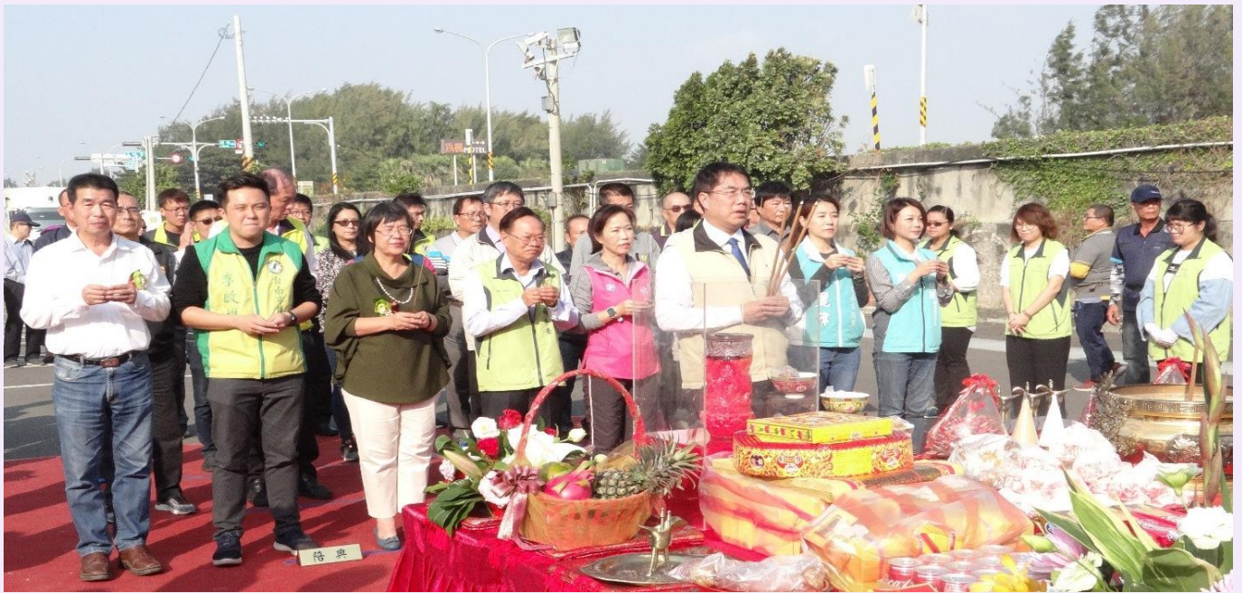
照片 1、108 年 12 月 18 日，市長主持動土典禮

臺南市曾經名噪一時的南區黃金海岸，滄海桑田令人嘖嘖。臺南市政府規劃開發海岸廊帶公園，串聯濱海國家風景區再現黃金海岸昔日榮景，並走向國際觀光成為亮點。位於臨海第一線的公 62 及公 65 公園整體開發，該工程已於 109 年 1 月 6 日開工。