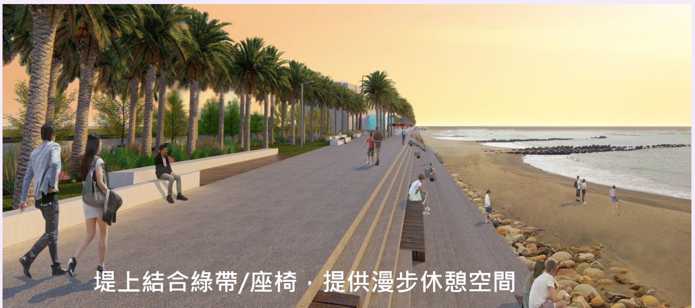
照片 3、公園闢建後休憩空間示意圖

黃金海岸廊帶公園相繼完成後，其優勢地理更可串連鯤喜灣園區，延續防風林之林蔭，更結合海岸復育、環保永續，提供觀光遊憩、環境體驗教學的海岸線，營造海岸風光及友善景觀海堤，讓原本公告的危險海域，成為具備有安全與適度親水遊憩機能；另方面由第六河川局進行養灘、填砂造陸，黃金海岸走向國際發展指日可待