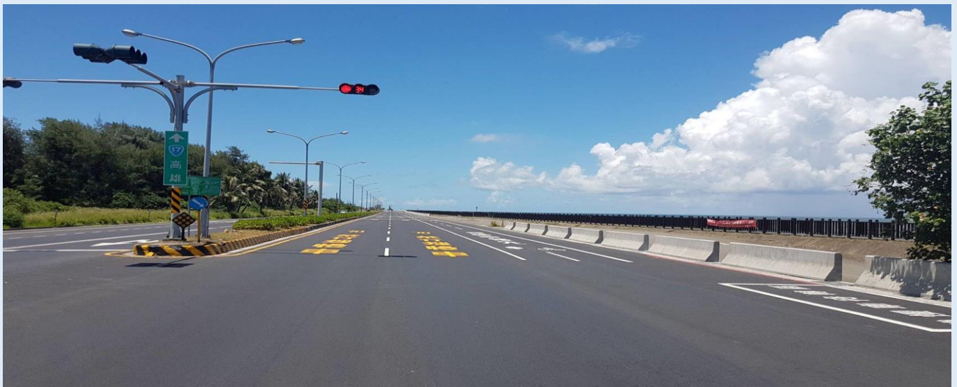
照片 1、濱南路改善後

濱南路路面改善工程於路面銑刨加鋪時添加轉爐石 BOF 取代粗粒料提高鋪面勁度，降低路面發生車轍現象以延長瀝青路面之使用年限；另本局精進要求各管線單位人手孔下地，待日後依需求再以人手孔新工法規定提升至路面；這項措施除縮短施作工期外，道路滾壓及拉平可更確實，提升路面品質及使用年限。