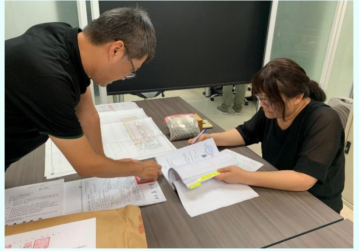
照片 1、單一窗口專人專審

單一窗口專人專審制度是讓案件申請掛號成功後，隨即安排專人於掛號當日或次日優先審查，即使案件補正送達也不需另安排審查時間，採隨到隨辦方式，申請人即可於資料整理完成後進入最後審核，達到縮短期程之目的。另先前於 106 年推動 AB 圖袋政策落實行政技術分立成效良好，故於今年 7 月 1 日起執行第二階段之提升作為，推動 B 圖袋彌封新政策，由臺南市建築師公會落實書件協檢，建築師落實自主檢討，市府貫策行政審查，更有效加速執照辦理進度。