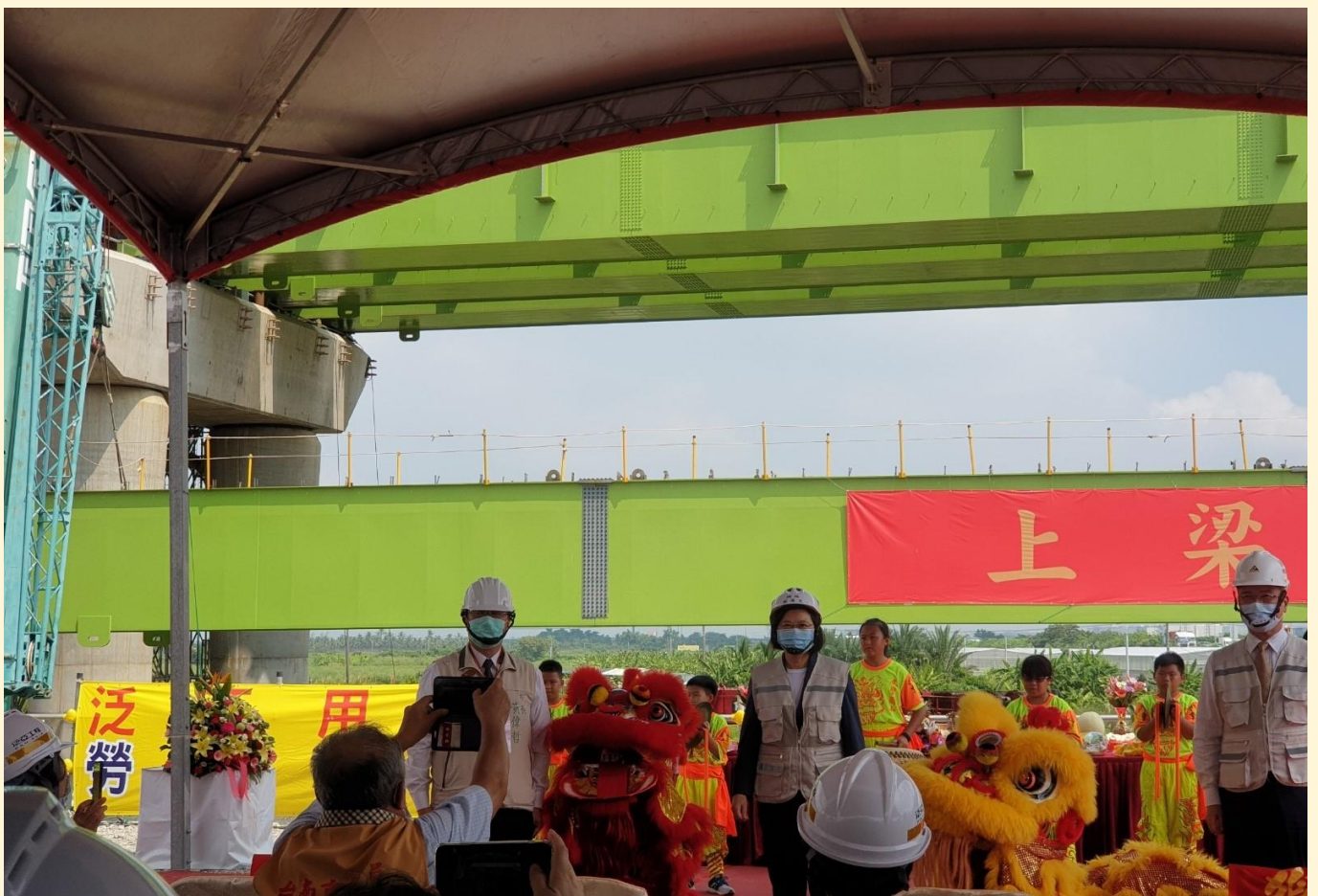
照片 1、蔡總統親臨現場主持典禮

臺南都會區北外環道路第 3 期新建工程於 109 年 9 月 14 日由蔡總統英文主持舉行鋼箱梁上梁典禮，象徵階段性工作完成。為因應「臺南科學園區特定區」發展所帶來的交通壅塞問題，積極向中央爭取經費，全力開闢周邊聯絡道路，臺南都會區北外環道路全線通車後，用路人從安平至南科只需 15 分鐘，將可有效改善南科聯外交通瓶頸。