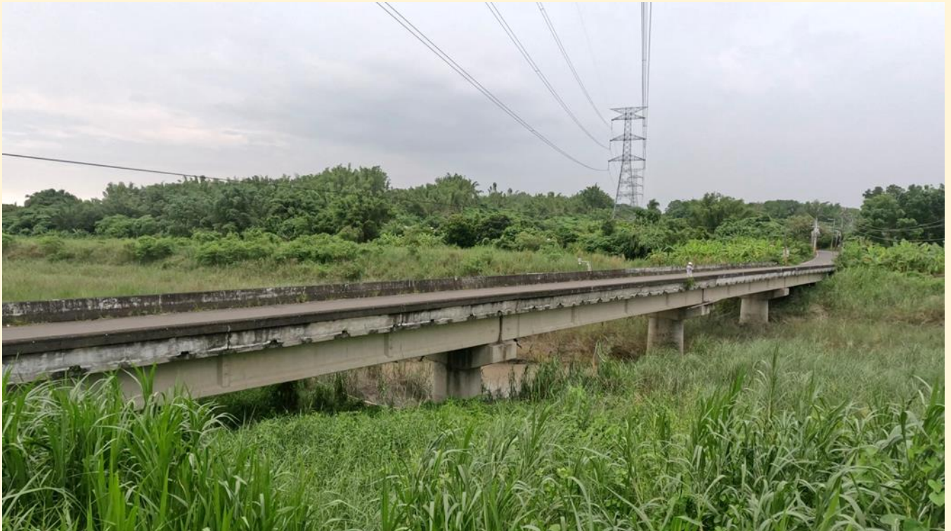
照片 2、民生橋改建前梁底高程不足

市府近年為改善新化區、左鎮區、楠西區及南化區道路通行安全及品質，陸陸續續辦理各項橋梁改建工程，隨著左鎮橋完工，包含正在施工中左鎮區澄山一號橋、大埔橋及民生橋陸續動工，未來市府仍會不遺餘力提報前瞻計畫，配合將附近主要道路戮力改善，達到「交通大便捷」的發展，並進而帶動觀光休閒。