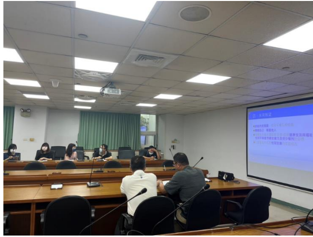
3. 「主管敏感度研習」課程開始前-8/7