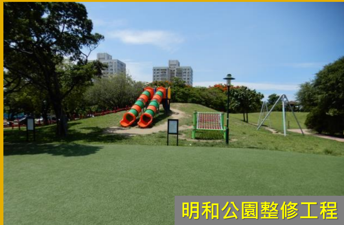
明和公園整修工程