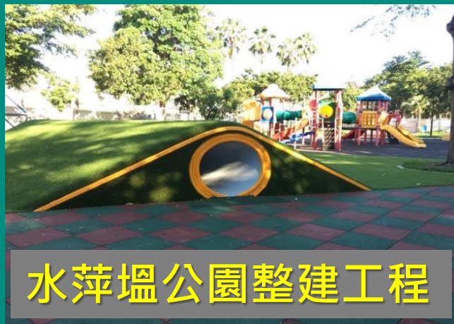
水萍塭公園整建工程