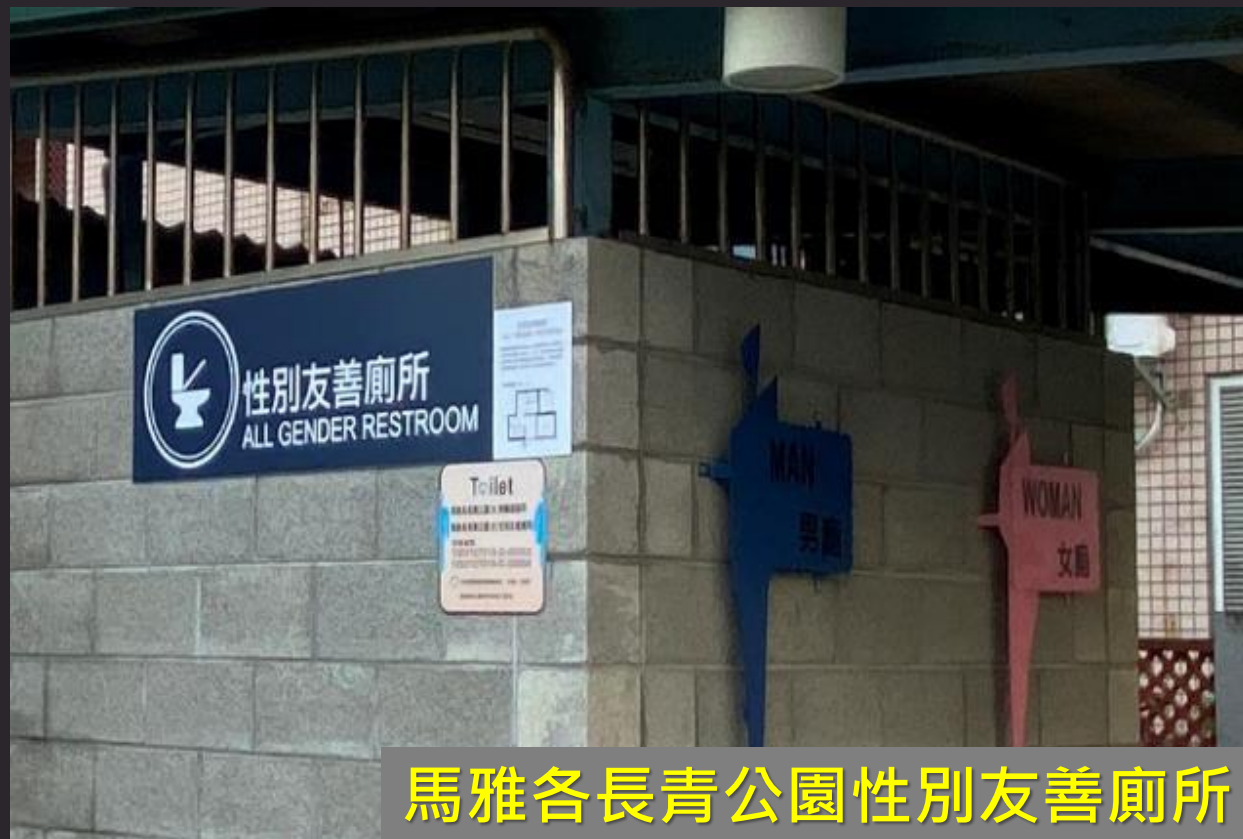
馬雅各長青公園性別友善廁所

無論使用者的生理性別， 性別認同 、 性別氣質 為何，都可 安心與自在地使用 。長者、小孩及行動不便者如廁時，身旁同行者可共同進出與協助，增加廁所空間使用效率，減少單一性別排隊問題。