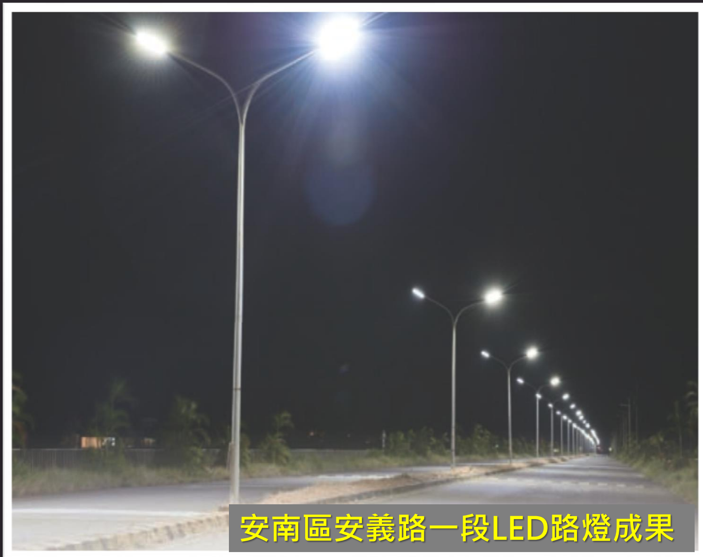
安南區安義路一段LED路燈成果