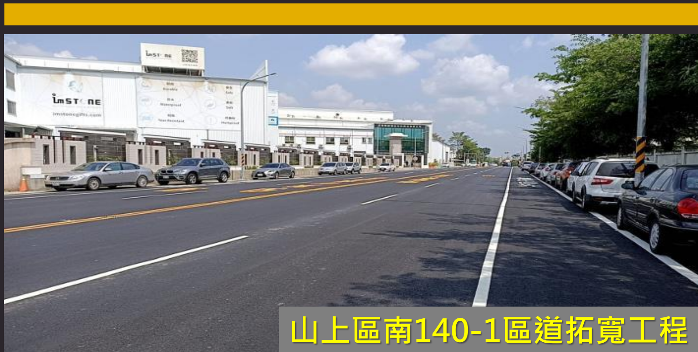
山上區南140-1區道拓寬工程