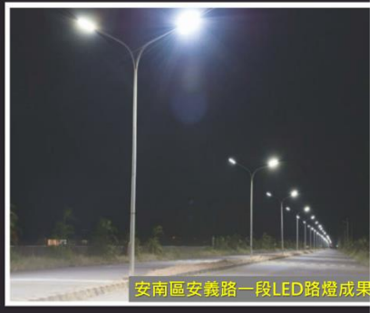
安南區安義路一段LED路燈成果