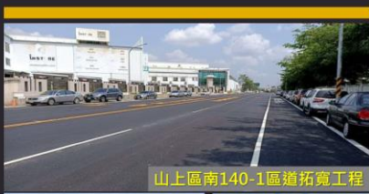
山上區南140-1區道拓寬工程