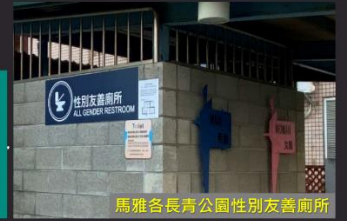
馬雅各長青公園性別友善廁所

無論使用者的生理性別、性別認同、性別氣質為何，都可安心自在地使用。長者、小孩及行動不便者如廁時，身旁同行者可共同進出與協助，增加廁所空間使用效率，減少單一性別排隊問題。