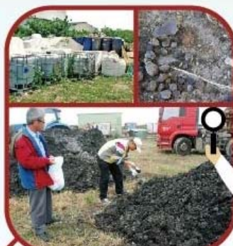
非法棄置場址 illegal dumping site