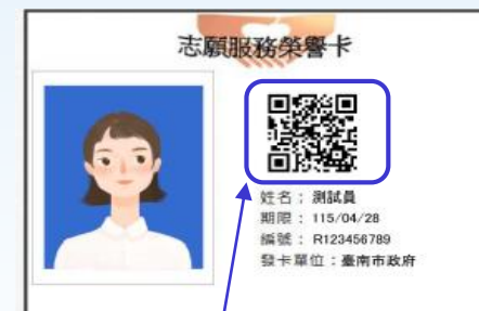
榮譽卡防偽辨識機制