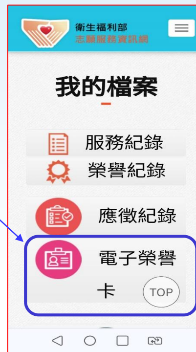
《手機版》登入後畫面