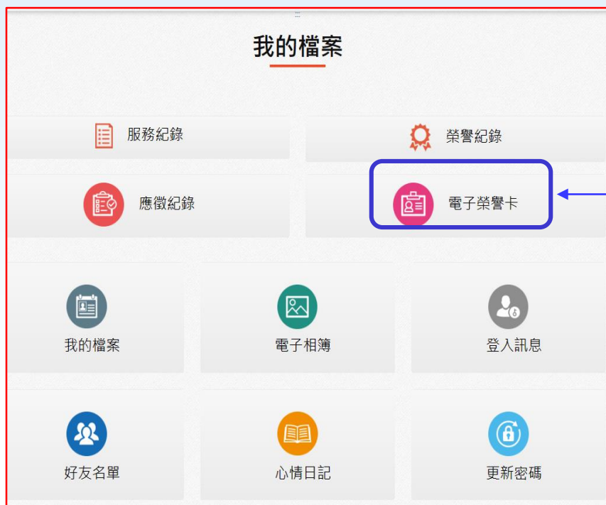
《電腦版》登入後畫面

◎登入衛福部志願服務資訊網( https://vol.mohw.gov.tw/vol2 )