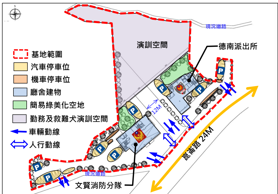
圖 6-1 基地初步配置與動線系統構想草案示意圖

基地整體規劃為三大空間，東側為警察局德南派出所使用，西南側為消防局文賢分隊使用，北側暫時規劃為警、消及救難犬勤務演訓空間，未來將視需求供臺南市政府暨所屬機關使用，另於基地中央設置 12 米通路，利於北側演訓空間及人員車輛出入，整體基地初步配置與動線系統構想如下圖所示。