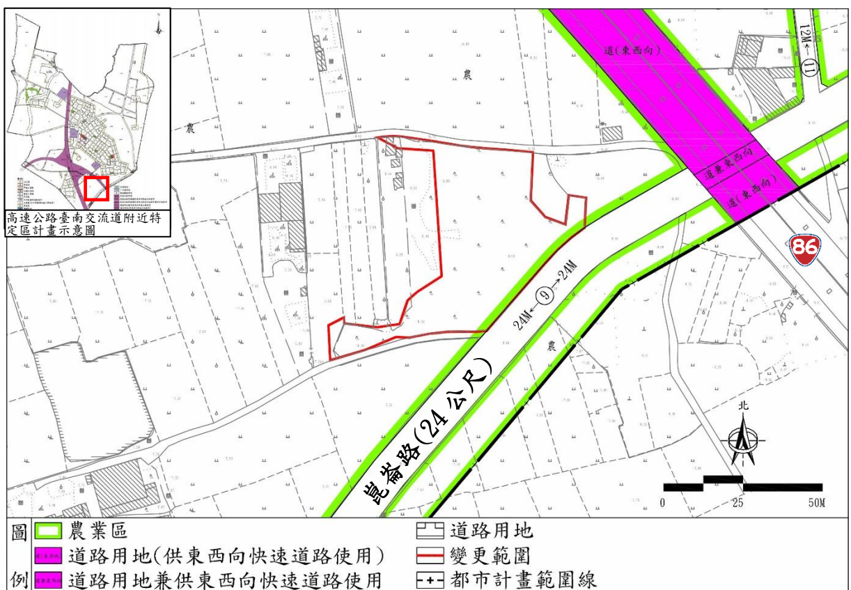
圖 3-1 變更位置與範圍示意圖

本案基地座落於臺南市仁德區 24 米崑崙路旁，近台 86 快速道路，屬「高速公路臺南交流道附近特定區計畫」南側之農業區部分用地範圍，變更範圍為臺南市仁德區中軍段 923 地號全部範圍土地，土地所有權人為臺南市，管理機關為臺南市政府民政局，變更面積約為 0.88 公頃，其變更位置與範圍如圖 3-1 所示，本次變更係配合「變更高速公路臺南交流道附近特定區計畫（部分農業區為機關用地）（配合文賢消防分隊暨德南派出所新建工程）」修訂土地使用分區管制要點，要點適用範圍為高速公路臺南交流道附近特定區計畫區。