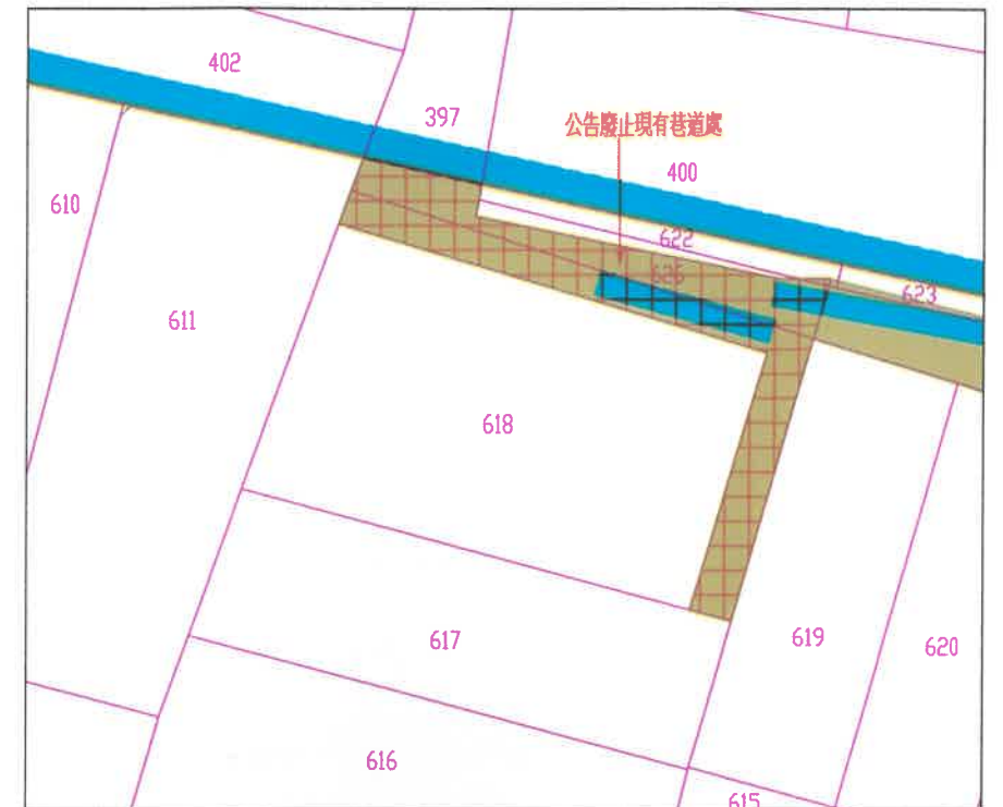
地籍套繪圖 SCALE 1/200